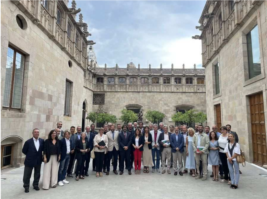
Varios representantes políticos han apoyado la candidatura Jocs d'Hivern 2030