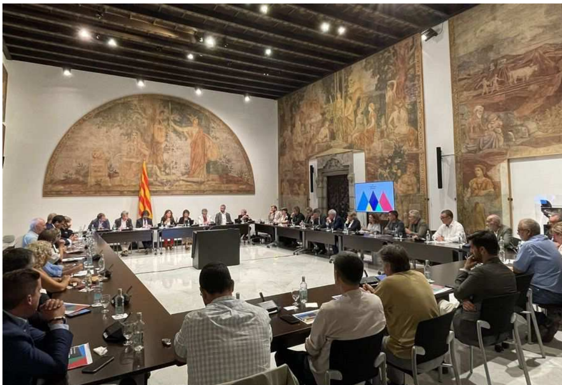
Momento de la presentación de la Candidatura Jocs d'Hivern 2034

tengan una valoración del COE para decir que "efectivamente hay candidatura catalana" .