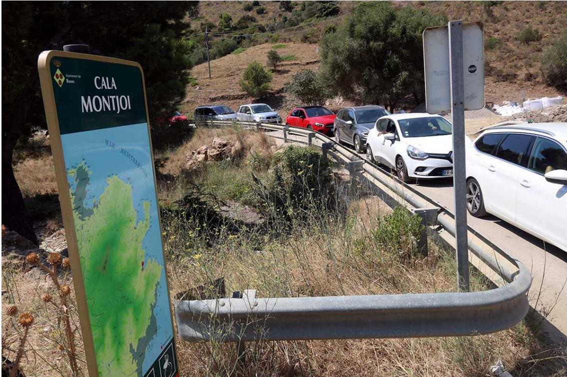
Vehicles accedint a la platja de Cala Montjoi en una imatge del 15 d'agost de 2020.

Jaacabo. Tornant a enllaçar amb la qüestió dels Jocs d'hivern a la qual feia referència l'inici de l'article, penso que la possible candidatura Pirineu Barcelona 2030 aniria bé per accelerar unes inversions en serveis i comunicacions que no acaben d'arribar mai al Pirineu. Consti que tenen raó quan diuen que s'haurien de fer amb independència dels JJOO. Però, tindrien a la Seu d'Urgell el canal olímpic de no haver estat pels JJOO de Barcelona 92?