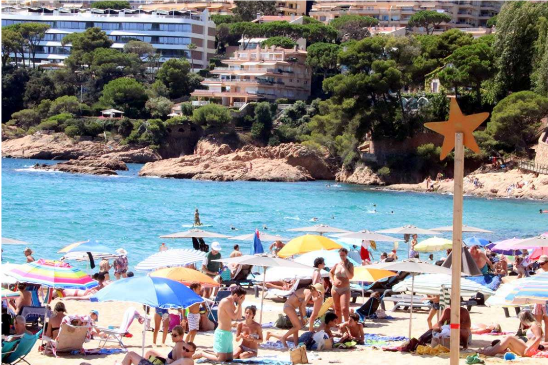
Platja de Sant Pol a S'Agaró el 17 d'agost de 2017.

I dins la societat ho han posat especialment en el punt de mira els representants determinats partits polítics o col·lectius, així com alguns opinadors que gaudeixen d'una tribuna pública i des de la qual tenen el privilegi de difondre les seves reflexions. I sense pràcticament oposició ni tampoc qui els contradigui. I es van creixent i reafirmant, és clar.