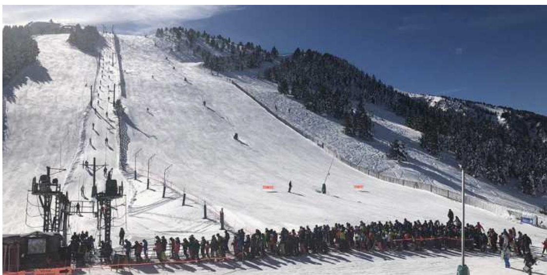
Cua als telesquís de la Tosa de Masella Autor/a: Diaridelaneu.cat

Ja fa temps, especialment a partir del protagonisme que ha adquirit en el darrer any i mig la candidatura als Jocs d'hivern de 2030, que l'animadversió cap als esports de neu i el món de l'esquí més en concret, ha anat creixent en una part de la societat. De retruc, el Pirineu és en el punt de mira. I normalment amb un punt de vista hipercrític. A vegades despectiu en un àmbit i en contrast idealitzat en uns altres sectors.