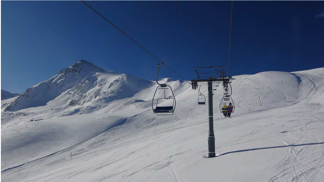
Telecadira de La Mine a l'hivern passat. Aquesta imatge ja és història (imatge d'arxiu).

El telecadira de La Mine de Porté Puymorens sempre havia estat una instal·lació motiu de conversa entre els clients de l'estació de la Vall de Querol. Ben lògic: és el remuntador que transporta els esquiadors a la cota més alta de l'estació i, precisament pel que implica aquesta condició, és molt cobejat pels qui busquen la bona neu i les bones panoràmiques.