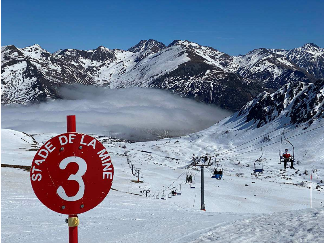
Telecadira de La Mine en una imatge hivernal (Imatge d'arxiu)

Tal com va avançar el director de Porte Puymorens, Eric Charre , a Diaridelaneu l'hivern passat, aquest telecadira s'ha començat a retirar aquest juliol. El següent pas serà la instal·lació d'un nou giny mecànic més modern, de més capacitat i més ràpid: un telecadira desembragable de 6 places.