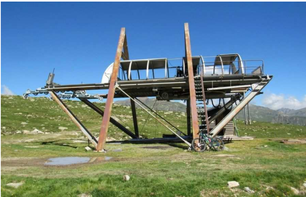
Desmontaje del TSF2 de la Mine.