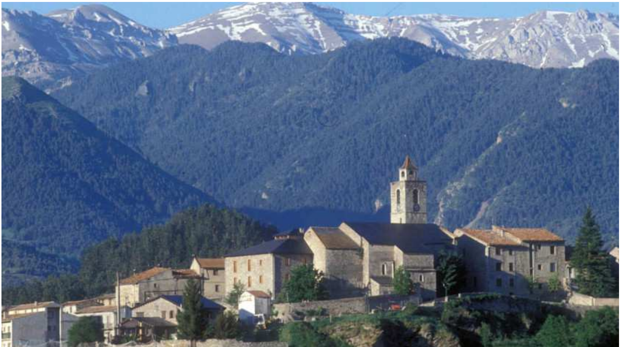
Imatge panoràmica de Bellver de Cerdanya

L'Ajuntament de Bellver de Cerdanya prohibeix l'ús d'aigua dels dipòsits municipals de la xarxa municipal de subministrament d'aigua potable per regar jardins, omplir sardines o realitzar qualsevol altra activitat d'aquest tipus. Així ho ha decretat l'alcalde del