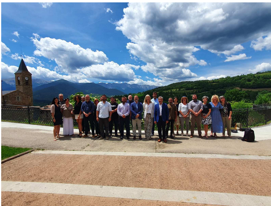
Foto de família dels assistents a l'acte "Fons Next Generation: reptes i oportunitats" a Prullans

Pel que fa a les comarques de l'Alt Pirineu i Aran , fins ara han rebut 2,17 milions d'euros , procedents de convocatòries de la Generalitat i de l'Estat. Els principals projectes guanyats de convocatòries que ha publicat la Generalitat han beneficiat 6 ajuntaments , que han rebut ajuts per a l'adquisició de llibres destinats a les biblioteques del Sistema de Lectura Pública de Catalunya; i 24 particulars i 4 empreses, que han estat perceptors d'un total de 0,15 milions d'euros de la convocatòria MOVES III del Programa d'incentius a la mobilitat elèctrica. L' Ajuntament de la Seu d'Urgell també ha rebut una subvenció d'aquest Programa, per un import de 0,004 milions d'euros.