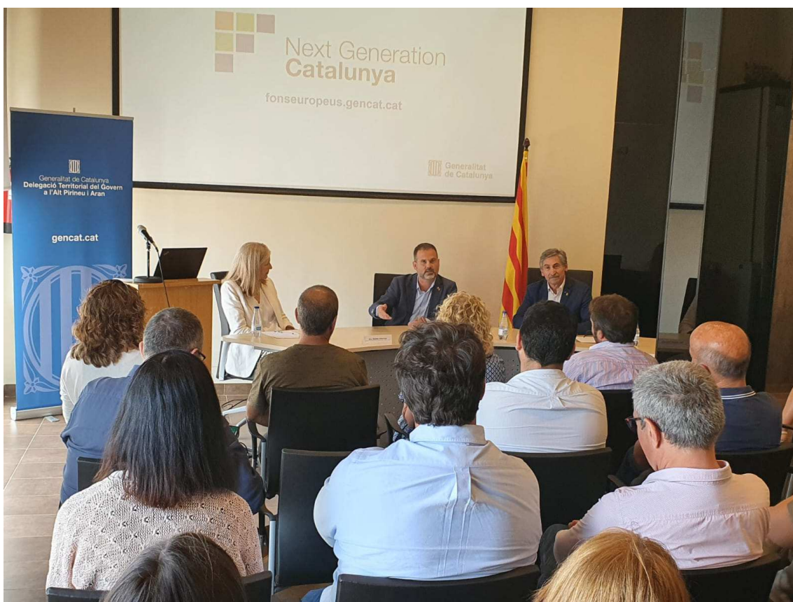
Acte "Fons Next Generation: reptes i oportunitats" a Prullans

El Govern ha publicat, a data 31 de maig, un total de 32 convocatòries i licitacions dels fons Next Generation EU, que mobilitzaran 429,6 milions d'euros. Són actuacions provinents del Mecanisme de Recuperació i Resiliència (MRR) que representen un 27,8% dels 1.545,3 milions ingressats a la Generalitat (dels 2.141,5 assignats fins al moment).