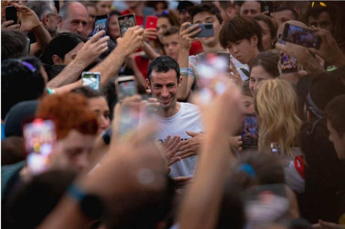
Kilian Jornet en la presentación de Zegama Aizkorri 2022

La carrera, de 42 km y 2.750 m de desnivel positivo partió muy rápido y, sorprendentemente, esta vez era el propio deportista catalán quien se ponía a estirar el grupo tras el primer bucle por Zegama. Pulsaciones a 190 y ritmo de 4:07/km en el primer kilómetro , sus intenciones estaban claras.