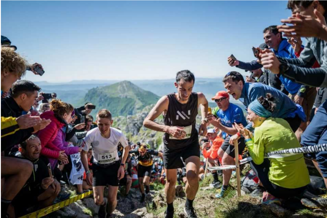
Kilian Jornet en Zegama Aizkorri 2022, en la subida al Aizkorri perseguido por Davide Magnini

“ Había estado entrenando muy bien para hacer los últimos 10 km y fue allí donde intenté irme. Hasta el Aizkorri no puedes saber si vas bien de cara al récord por las condiciones pero allí me di cuenta de que era posible e intenté conseguirlo”, explicó en la retransmisión.