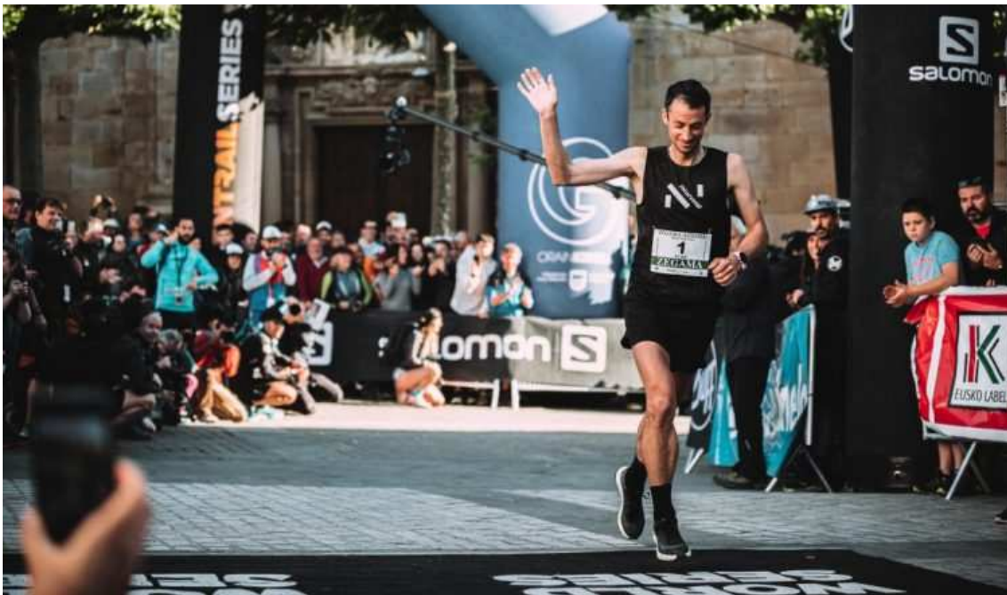
Kilian Jornet en Zegama Aizkorri 2022