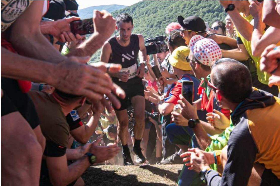
Kilian Jornet en Zegama Aizkorri 2022