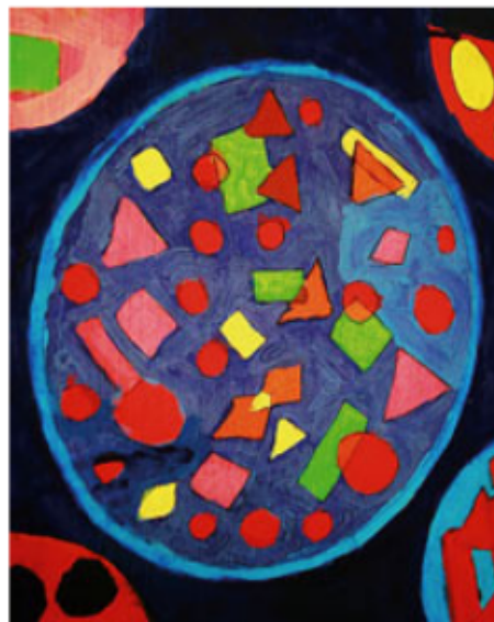
Aspecte de les diferents mandales que s'exposen a la seu de la Diputació.

elles serà una il·lusió molt gran saber que el que han treballat podrà ser exposat. També hi ha el valor dels qui fan una tasca encomiable perquè aquests joves empordanesos tinguin estímuls. Des del febrer del 2000, l'associació El Trampolí treballa la creativitat, la psicomotricitat i l'agi-