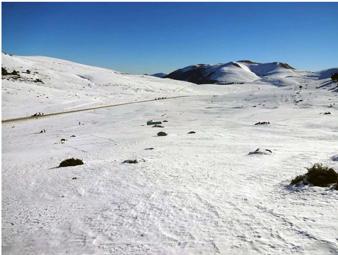
Vista parcial del Pla d'Anyella des de la pista Llevant i Clot de l'Hospital de La Molina.

En arribar el setembre de 2021, però, el president del Govern espanyol Pedro Sánchez anunciava que en la candidatura caldria incorporar el Pirineu aragonès i, en conseqüència, algunes de les proves que fins aleshores havien estat plantejades per a disputar al Pirineu català, passarien a fer-ho al Pirineu aragonès. Entre aquestes hi figurava l'esquí nòrdic, que en la proposta tècnica aprovada el 25 de març de 2022 passava a celebrar-se a Candanchú.