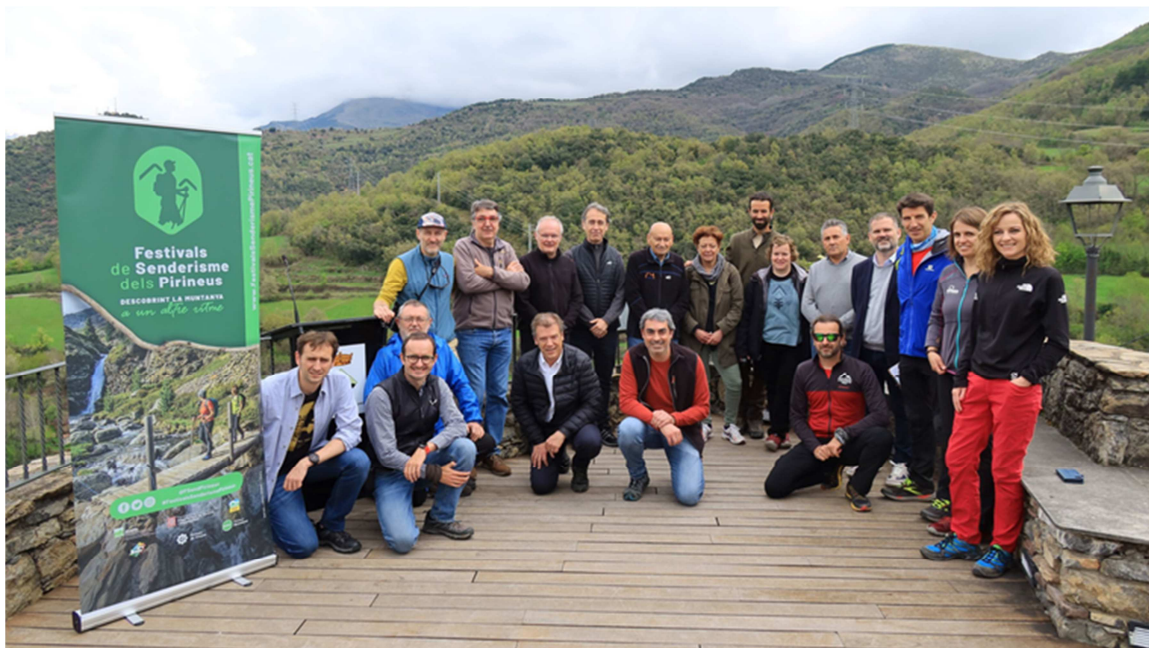
La 7a edició dels Festivals de Senderisme s'han presentat a la Vall Fosca

Són esdeveniments d'entre dos i set dies de durada que ofereixen a un públic ampli rutes guiades a peu per conèixer un territori, amb activitats culturals i gastronòmiques complementàries.