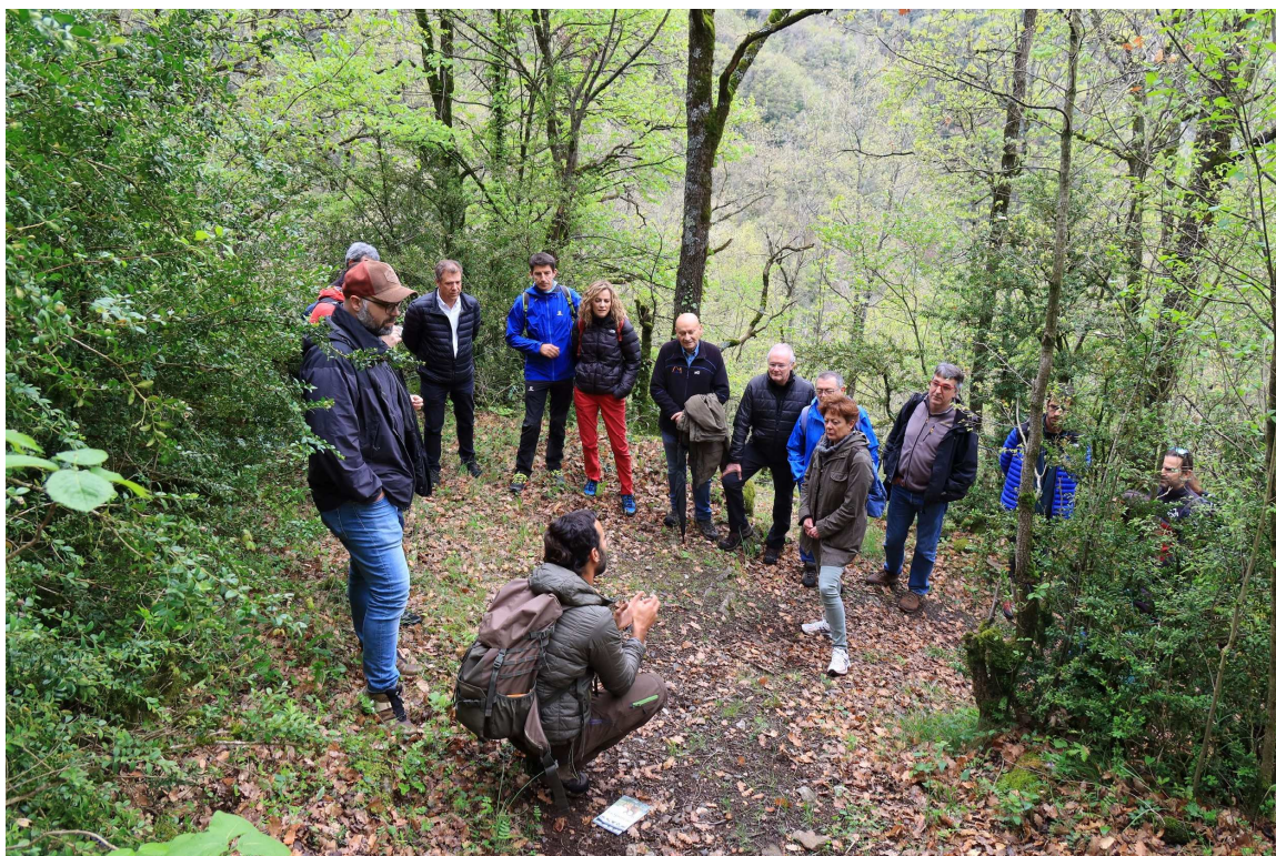
La 7a edició dels Festivals de Senderisme s'han presentat a la Vall Fosca/ govern.cat

Per ordre cronològic, els esdeveniments programats són el Festival Camina el Berguedà (14-15 de maig), Lo Festival de Senderisme de la Conca Dellà (20-22 de maig), el Garrotxa Volcanic Walking (3-6 de juny), el Cerdanya Happy Walking (9-12 de juny), el Festival Camina Pirineus Alt Urgell (17-19 de juny), el Festival de Senderisme Vall Fosca-Pirineus (7-10 de juliol), el Val d'Aran Walking & Summit Festival (25-31 de juliol), el Festival de Senderisme del Solsonès (17-18 de setembre), l'Alt Empordà Sea Walking (23-25 de setembre), el Ripollès Discovery Walking (30 de setembre-2 d'octubre), el Vall de Boí Trek Festival (8-9 d'octubre) i el Senderi-Festival de Senderisme de Sort, la Vall d'Àssua i el Batlliu (21-23 d'octubre).