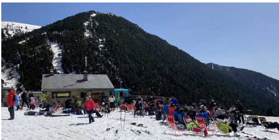
Baixen un 15% les pernoctacions respecte a la temporada 2019-20 Autor/a: Diaridelaneu

Baixen un 15% les pernoctacions respecte a la temporada 2019-20