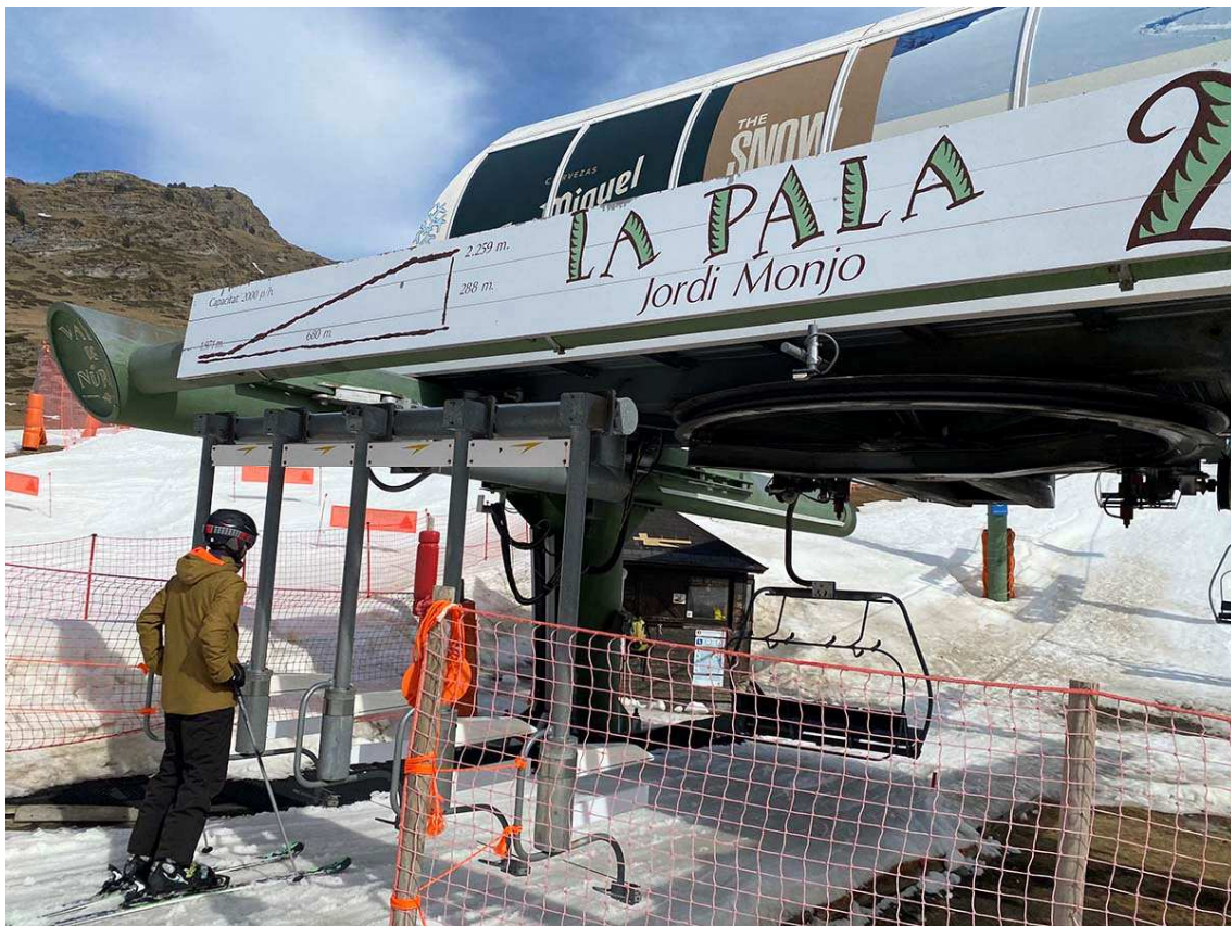
Esquiador a Vall de Núria el passat mes de març.

preservar l'entorn natural de l'espai i millorar l'experiència de viatge dels visitants. Pel que fa a Guils Fontanera (Cerdanya), ha rebut 12.653 usuaris entre forfets d'esquí i raquetes, sent els usuaris d'aquesta darrera modalitat el doble respecte de la temporada 2019/2020.