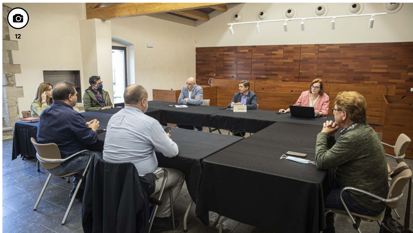
L'alcalde de Caldes es nega a dimitir i Junts li dona suport / DAVID APARICIO

Caldes de Malavella | 26·04·22 | 06:30 | Actualitzat a les 08:53