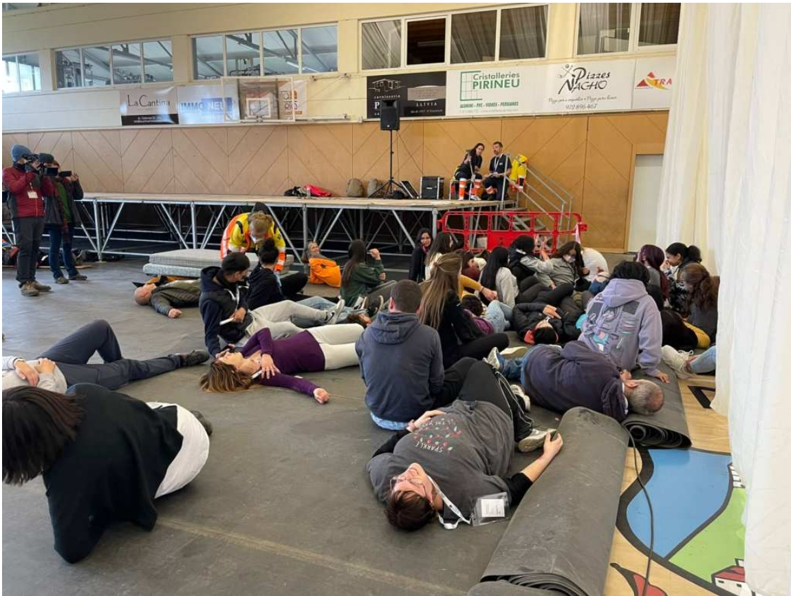
Un moment del simulacre a Llivia.

Per la seva banda, el cap de servei d'Ajuda Mèdica Urgent de l'Alta Garona, Vincent Bounes, ha apuntat que "partim del principi que la catàstrofe no entén de fronteres, ja que un autobús es pot accidentar en qualsevol costat de la frontera, així que hem de treballar tots junts per curar, salvar i socórrer les persones afectades". En aquest sentit, ha indicat que "és important que aquest projecte tregui els frens reglamentaris i les reticències que puguem tenir per treballar junts". "Ens coneixem millor, treballem junts, tenim el mateix llenguatge i els mateixos protocols i avui és la culminació de tota aquesta feina", ha reblat.