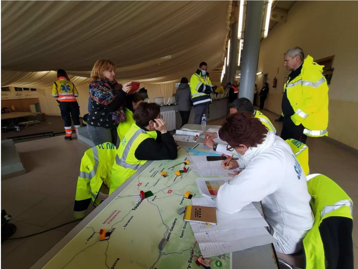
Un moment del simulacre a Llívia.