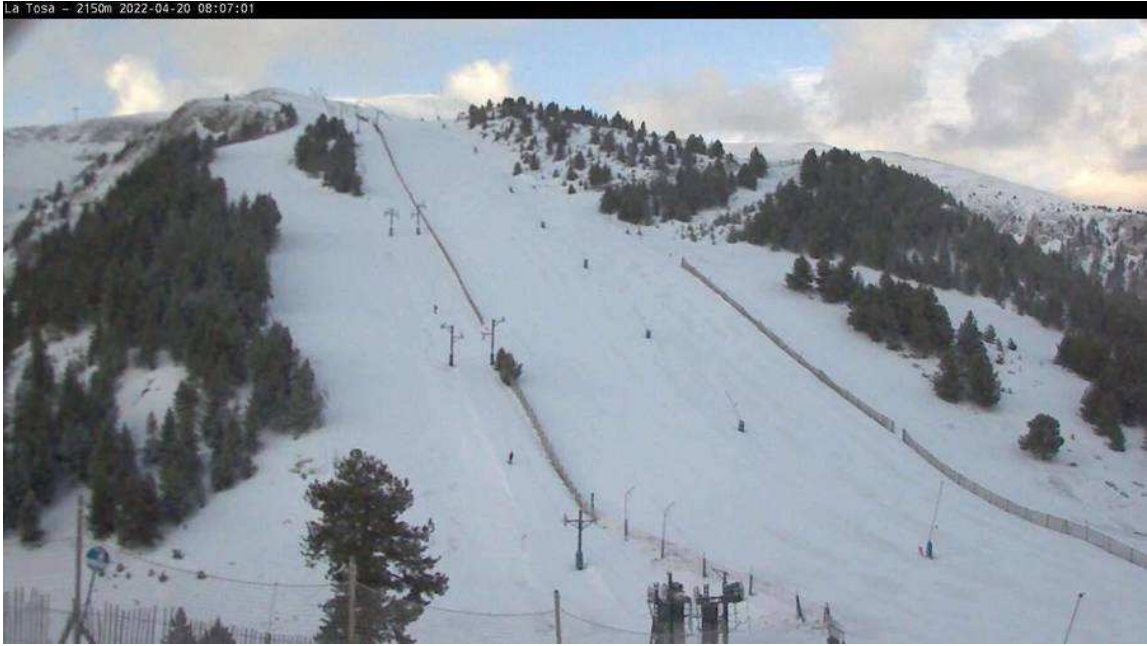
La Tosa-2535 en la zona alta de Masella, es donde hay más nieve