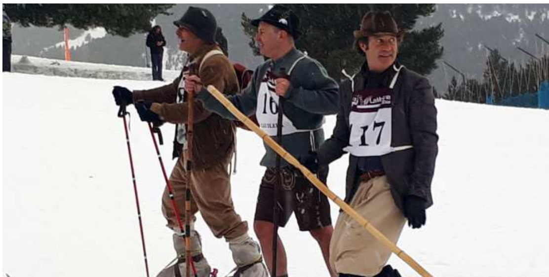
Tres esquiadors durant la I Cursa Retro de la Molina

L'estació commemora així l'efemèride en un acte que ja va repetir el 2018