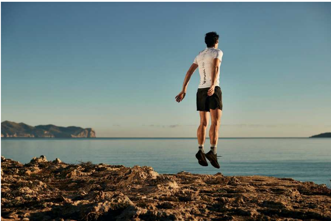
Kilian Jornet, embajador de NNormal

«Compartir valores comunes fue una motivación extra a la hora de iniciar este proyecto. Estábamos de acuerdo en que necesitamos una nueva manera de pensar y de actuar con relación al medioambiente y a las actividades al aire libre », explica Kilian Jornet. «Queremos ser muy honestos sobre la forma en que producimos el equipamiento y el papel que desempeña la empresa en la sociedad y el medioambiente. Esto se traduce en una total transparencia y en trabajar para evitar el consumo excesivo creando productos duraderos. A fin de tener un impacto mínimo en el medio ambiente, necesitamos trabajar con