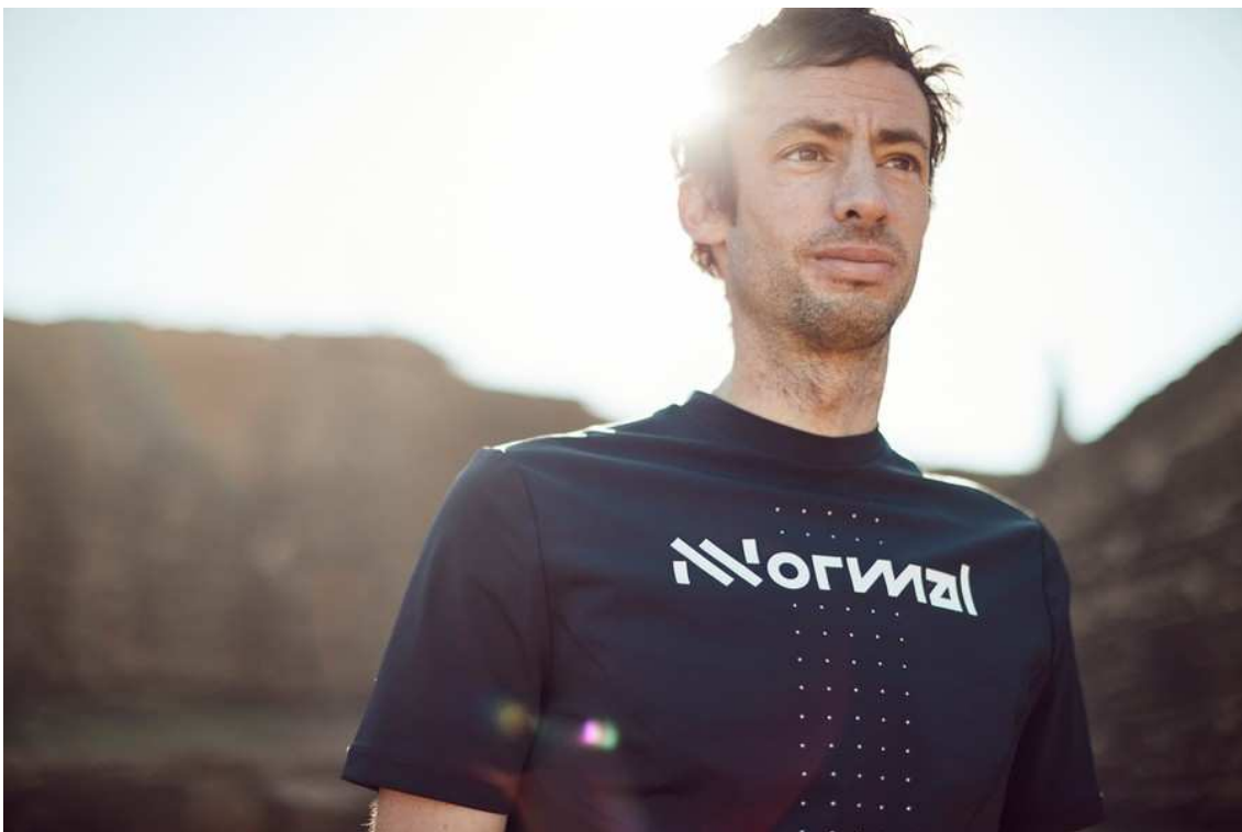
Kilian Jornet, embajador de NNormal