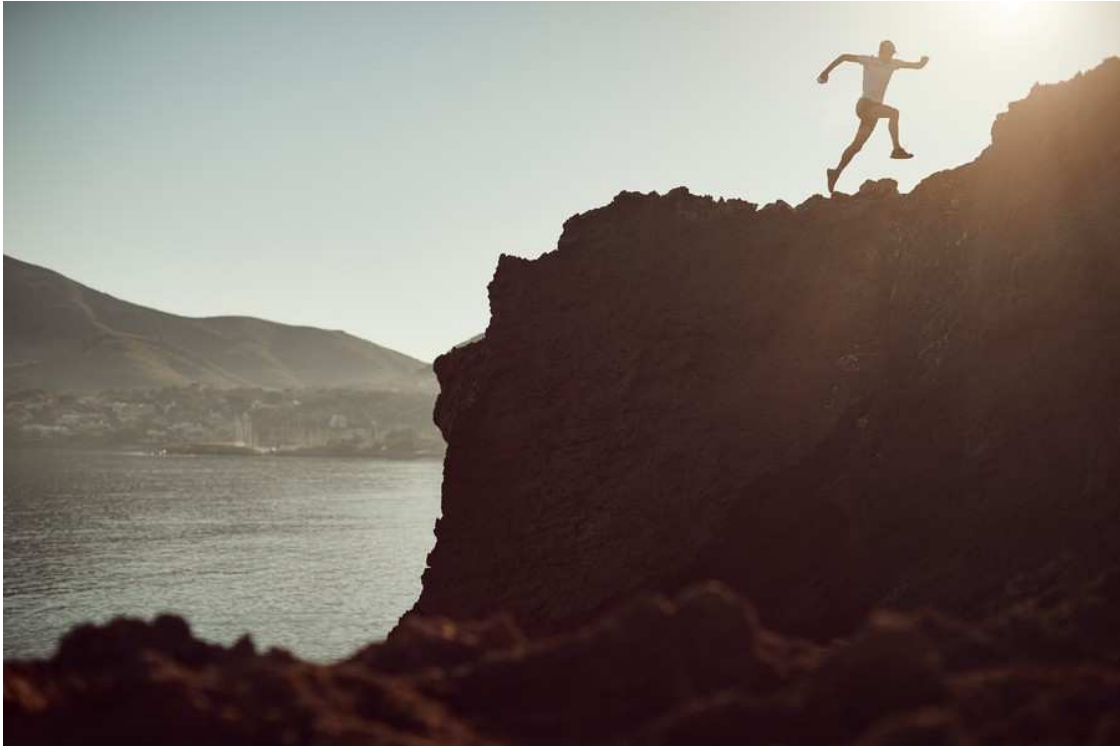
Kilian Jornet, embajador de NNormal