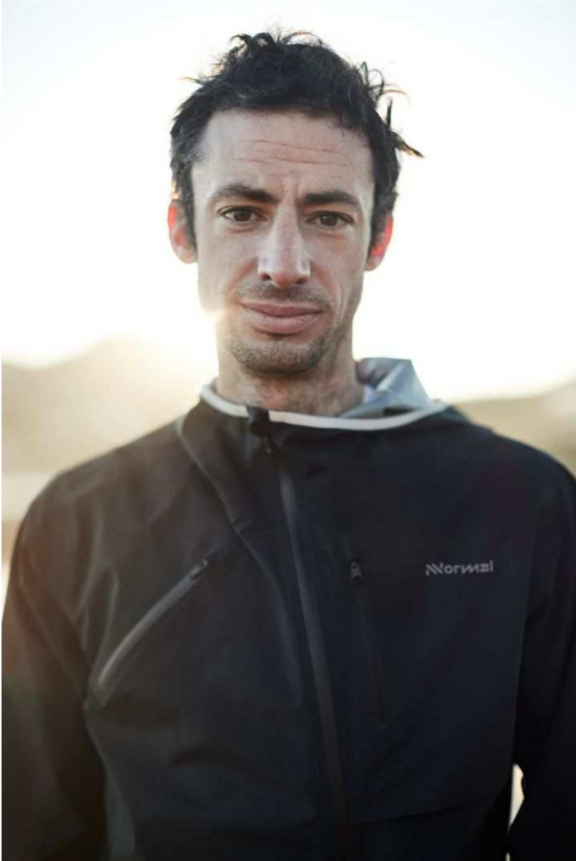
Kilian Jornet, embajador de NNormal