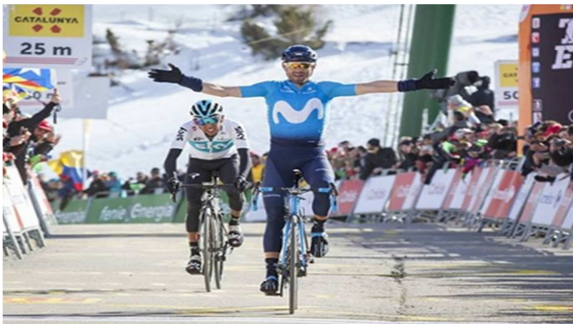
Alejandro Valverde va ser el guanyador l'any 2018 a l'etapa de La Molina

La Volta Ciclista a Catalunya és la tercera prova ciclista per etapes més antiga del món després del Tour de França i el Giro d'Itàlia