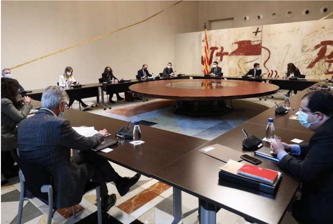
Reunió del Consell Executiu del Govern

El Govern ha tornat a descartar la incorporació del Berguedà, el Ripollès i el Solsonès a la votació. Ara bé, els alcaldes de les capitals d'aquestes comarques sí que podran participar a la Taula de representació territorial del projecte de la candidatura dels Jocs, juntament amb els alcaldes de les sis comarques de l'Alt Pirineu i l'Aran, les úniques els residents de les quals votaran a la consulta. L'organisme ja comptava amb representants del Govern, així com dels consells comarcals de les sis comarques de l'Alt Pirineu i l'Aran, així com del Berguedà, el Solsonès i el Ripollès.