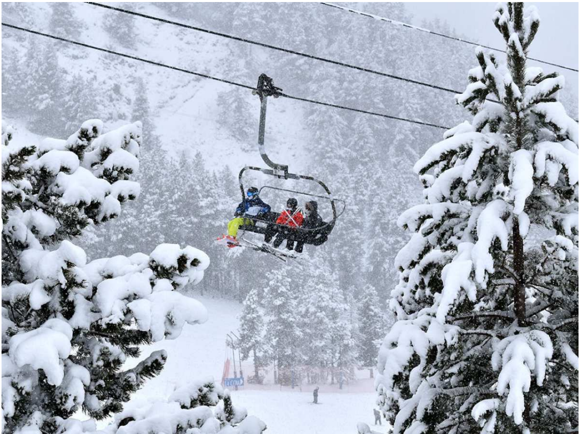
La primavera en el Pirineo oriental viene con nieve