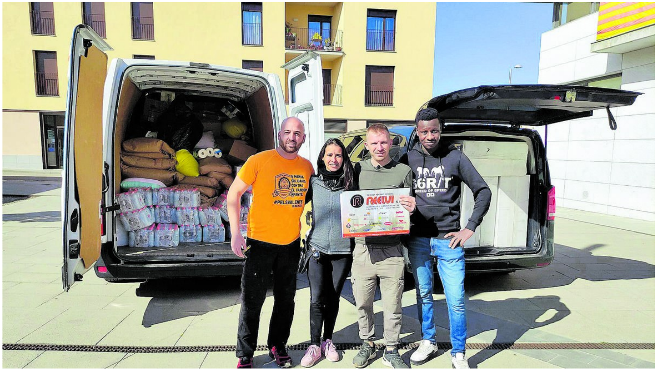
Els tres joves que marxen cap a la frontera amb les furgonetes plenes i una companya que els ha ajudat en la logística

D os gironins, Sisu i Robert, van agafar aquest dimecres l'autocaravana i van decidir anar a ajudar el poble ucraïnès. Des de l'Escala, on resideix un d'ells, van aconseguir recollir productes farmacèutics, roba i menjar infantil per portar als refugiats que són a la frontera amb Polònia.