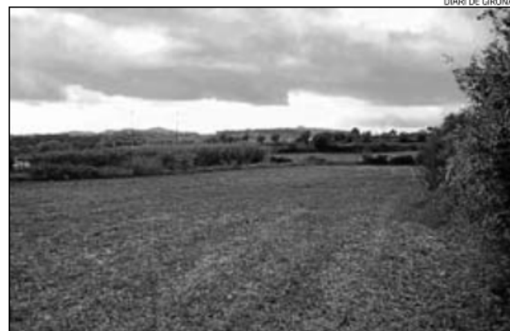
Terrenys de Corça afectats per l'opció Nord.

Discorre més propera al nucli urbà de la Bisbal, pel sud, i té 10,6 quilòmetres. Passa pel sud de la zona