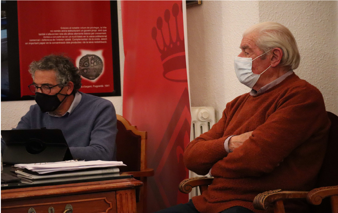
Ple de l'Ajuntament de Puigcerdà / puigcerda.cat

A nivell cultural, es preveu continuar les obres per fer visitables el túnel del Passeig i la sala del Museu Cerdà dedicada a la història de Puigcerdà.