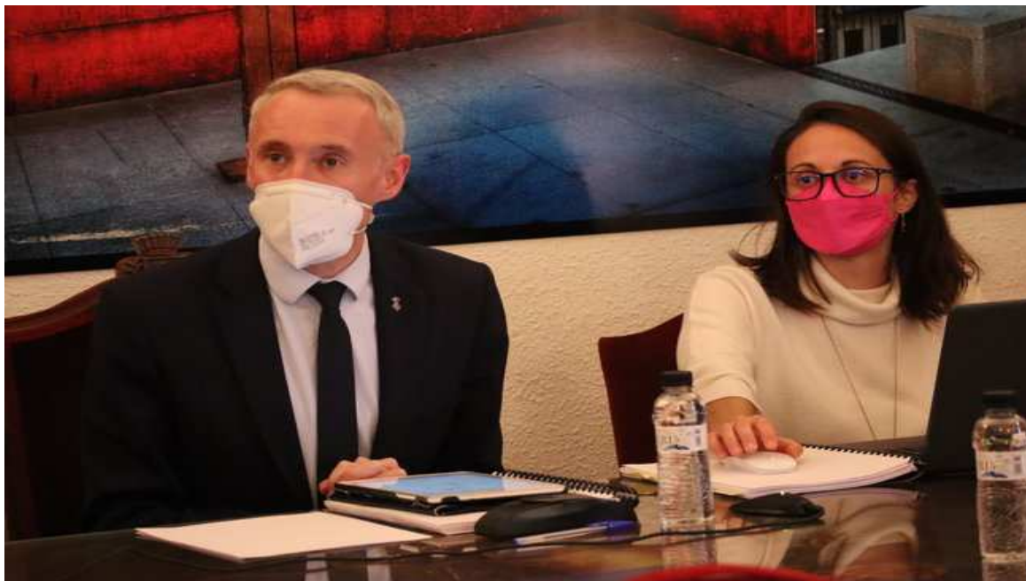
L'alcalde Albert Piñeira durant el Ple d'aprovació dels Pressupostos 2022

El capítol d'inversions suposa un 21,15% del seu total, gairebé 3,3 milions d'euros en actuacions diverses.