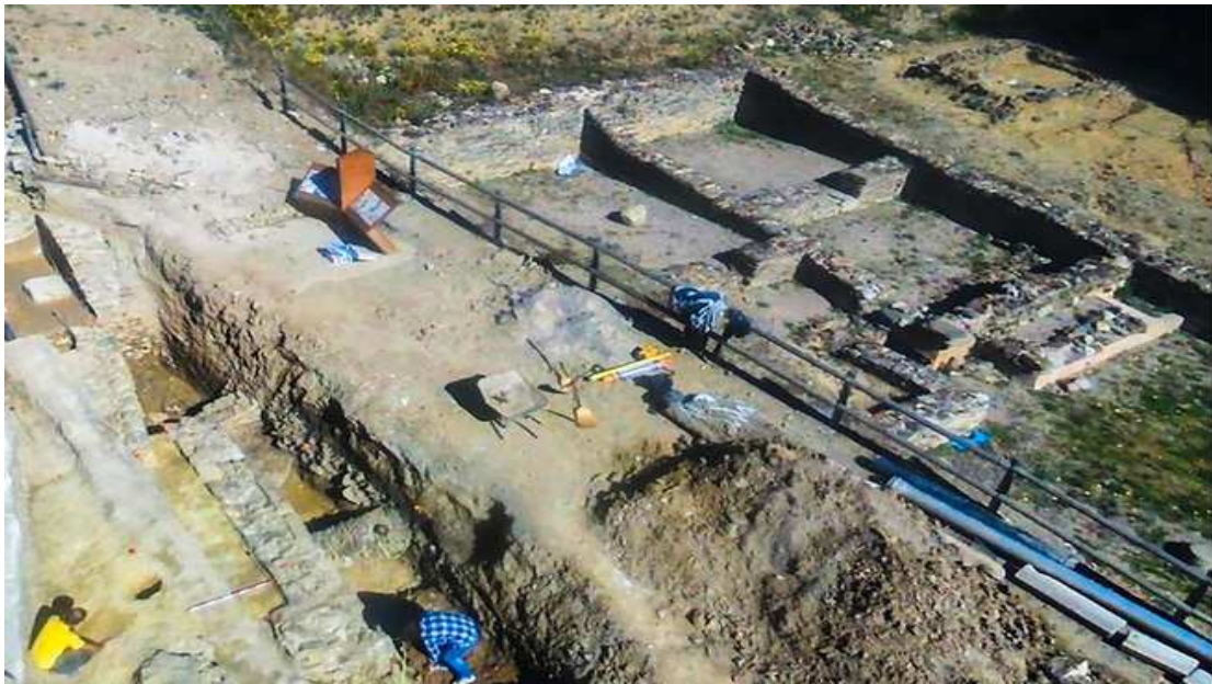
forum estatutària 03

La publicació d'un nou article referma el valor patrimonial d'aquest jaciment situat al bell mig del Pirineu i el situa en el panorama internacional