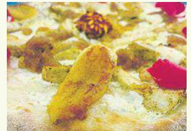
Fabián Martín, campeón del Mundo de Pizzas en 2007, 2009 y 2010, creó la pizza Nadal y la pizza Aubameyang en su restaurante de Puigcerdà

El campeón del mundo de pizza cocina desde su restaurante de Puigcerdà