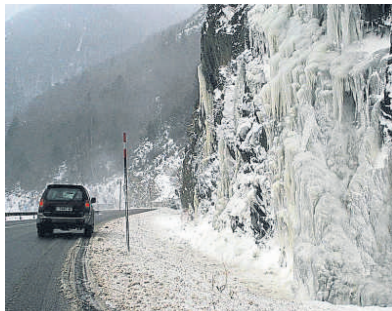
L'N-230, una de les vies que es beneficiarien d'aquests jocs

Són inversions que traspassarien l'àmbit esportiu i que caldria interpretar com a beneficioses per a la població en general, amb independència de quines comarques o estacions d'esquí seran seus de les proves. Ho entén així