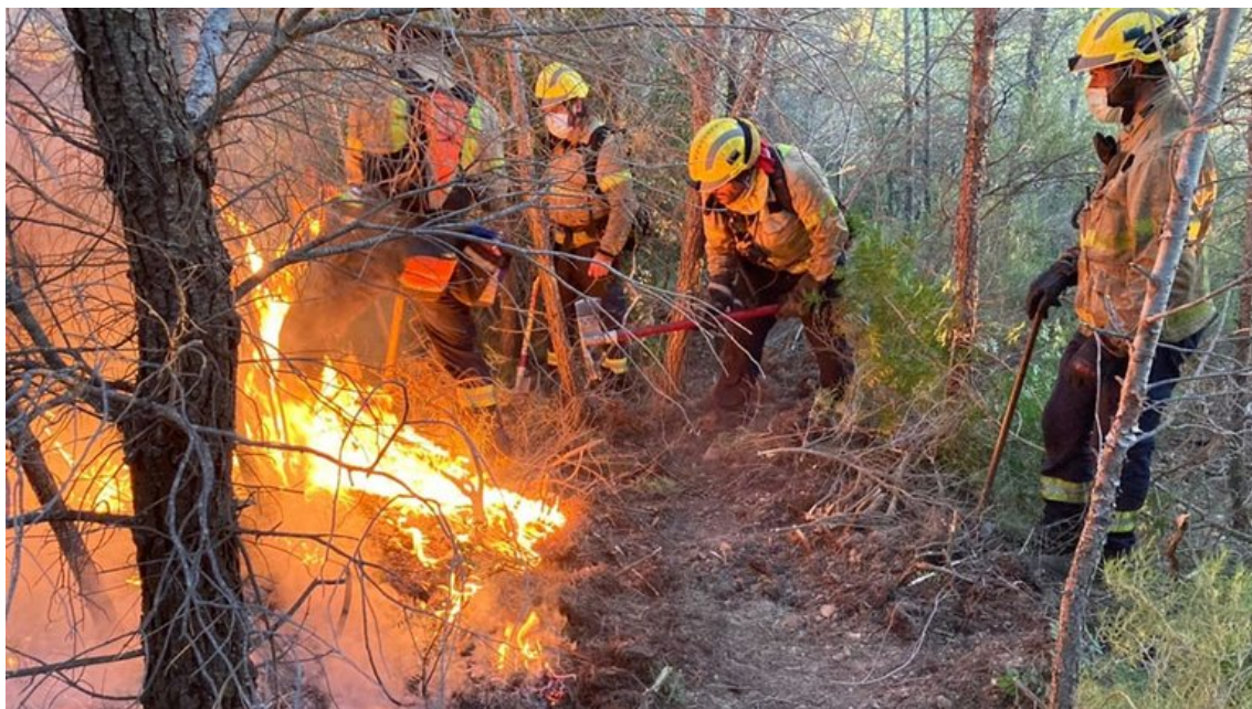
Els Bombers apagant un incendi de vegetació

El Pirineu i Prepirineu encaren una situació d'elevat risc d'incendi, que en algunes comarques es pot allargar fins a divendres