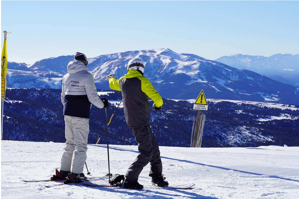
Bones panoràmiques des del retorn del telecadira

La directora avança que de cara a les setmanes vinents la previsió és que s'obrin més pistes i més remuntadors. Està previst que es posi en marxa el telesquí de Credells, que remunta fins a la cota 2.600 i amb el qual es podrà obrir un ventall de noves pistes blaves, vermelles i negres i, molt important, l'àrea destinada a l'esquí forapista. En el mateix sentit es preveuen oferir noves activitats a la zona lúdica de Cotzé.