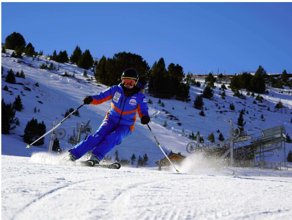
Clavant cantells en unes pistes gairebé desertes.

Ara com ara l'estació té oberts un telecorda i el telecadira Combe des Rameaux. Pel que fa a pistes hi ha obertes la pista Blava Dura Neu (veure fotos i vídeo), la pista verda de connexió amb Cotzé (el retorn fins a les Planes es fa amb bus o navette), una pista vermella i una pista negra. De cara als pròxims dies està prevista l'obertura del teleesquí Credells i més pistes, tal com ha informat la seva directora.