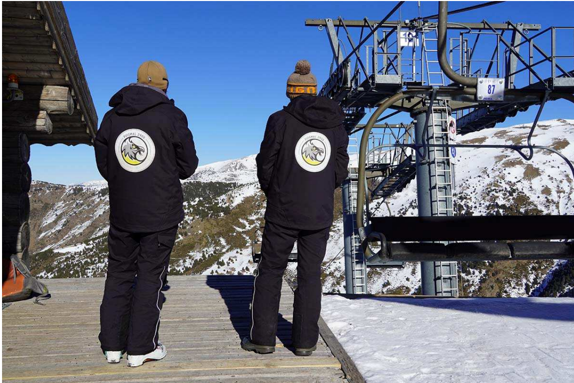
Dos treballadors de Puigmal 2900 a la plataforma d'arribada del telecadira Combe des Rameaux ahir divendres.

Que esquiar entre setmana acostuma a ser sinònim de fer-ho amb poqueta gent és una qüestió ben sabuda per tothom. Però fer-ho gairebé en família, en un dia de sol i neu pols, ja és un fet que es pot qualificar d' excepcional. Així és com em vaig trobar ahir l'estació d'esquí de Puigmal 2900, que enguany ha reobert després de vuit anys d'estar tancada.