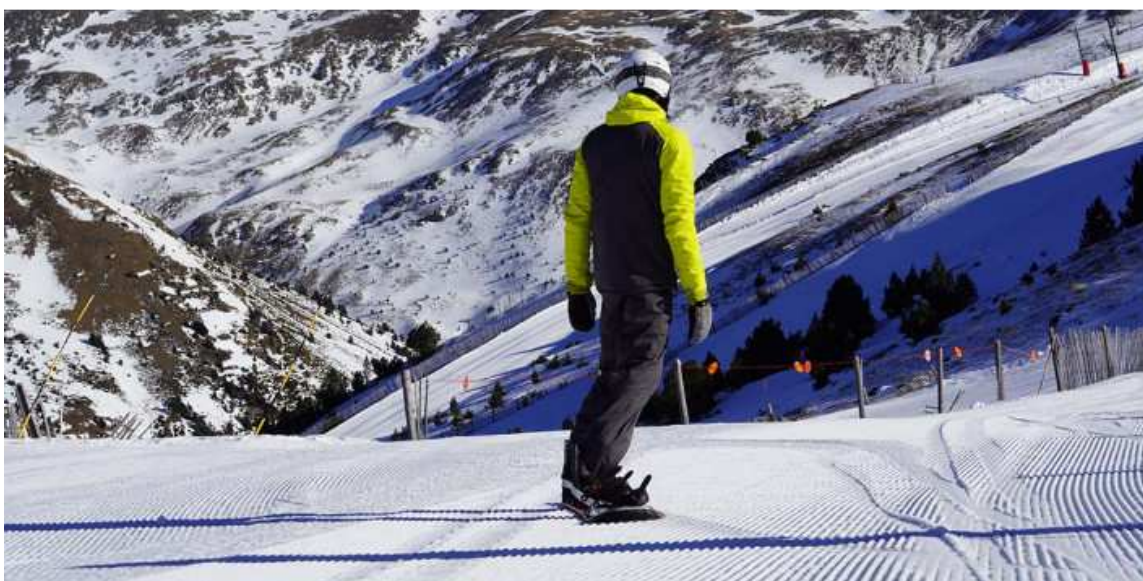
Puigmal 2900 prepara l'obertura de més remuntadors

La directora de l'estació ens explica com va la temporada i avança l'obertura de més remuntadors