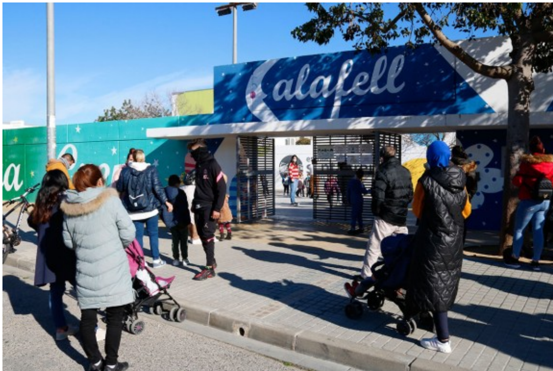
Una escola de Calafell, al Baix Penedès

L'alcalde de Calafell, Ramon Ferré , ho atribueix a moviments migratoris, accentuats pel confinament per la Covid. Això comporta que el municipi hagi de respondre amb més habitatges i serveis. Actualment hi ha una promoció de 400 nous habitatges a segona línia de mar, bona prova de la recuperació de l'activitat constructora, sector amb gran pes en aquest territori i alhora el més castigat per la crisi econòmica del 2008. El sector remunta i els preus també.