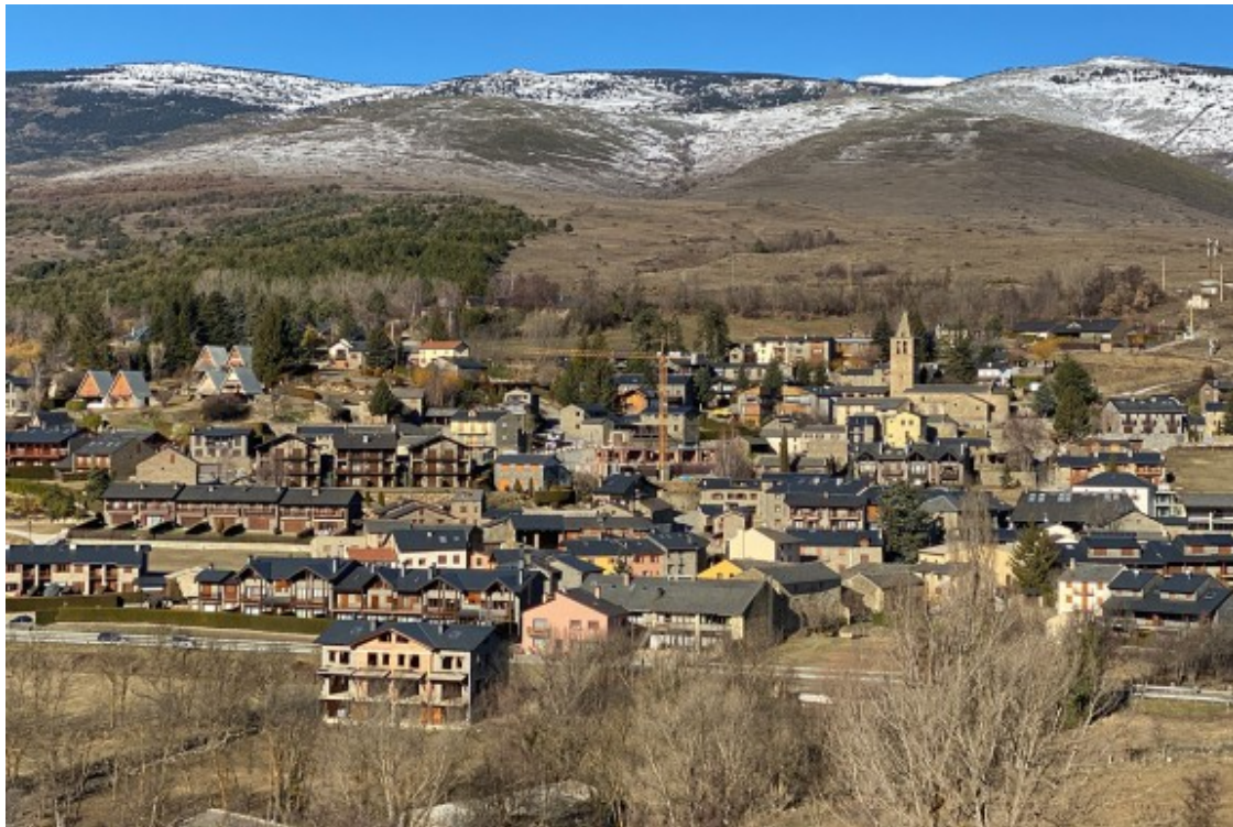
El poble de Bolvir, a la Cerdanya.

Entre les destinacions dels qui marxen de la ciutat es troba l'Alt Pirineu i Aran. L' Alta Ribagorça (3,1%) i el Pallars Sobirà (2,46%) són la segona i tercera comarques que més creixen, però són els municipis de la Cerdanya -la que més creix- els que més s'enfilen a la zona, com ara Bellver de Cerdanya , amb 130 nous habitants, o també Bolvir , amb 114, que és el municipi de tot Catalunya que ha experimentat un creixement de població més alt en percentatge.