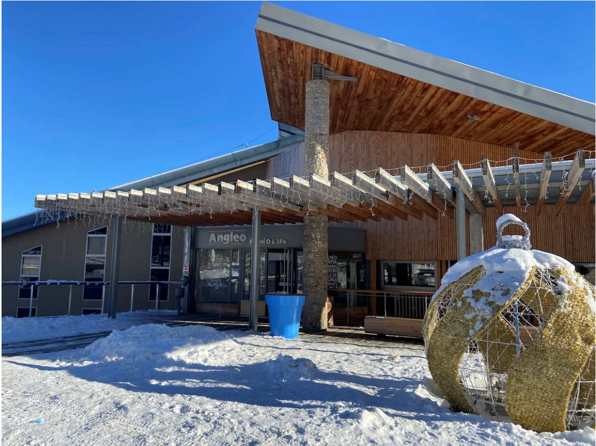
Una de les claus de l'èxit és que es tracta d'un espai realment acollidor

Pujar aviat a pistes, gaudir de l'esquí, aprofitar fins a l'últim minut... però també omplir les hores d'après-ski amb alguna activitat agradable i reconfortant. És el decàleg ideal de qualsevol esquiador. I les opcions són realment infinites. Però avui us en detallarem una d'ideal per a tots els assidus a Les Angles, una estació que, tal com ja us vam explicar, és un paradís visual ideal per a tots els nivells.