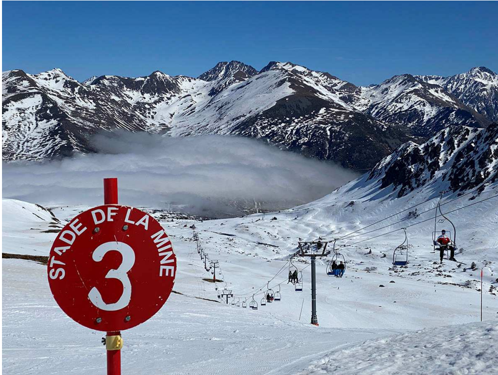
L'estació podrà ampliar el seu domini esquiable