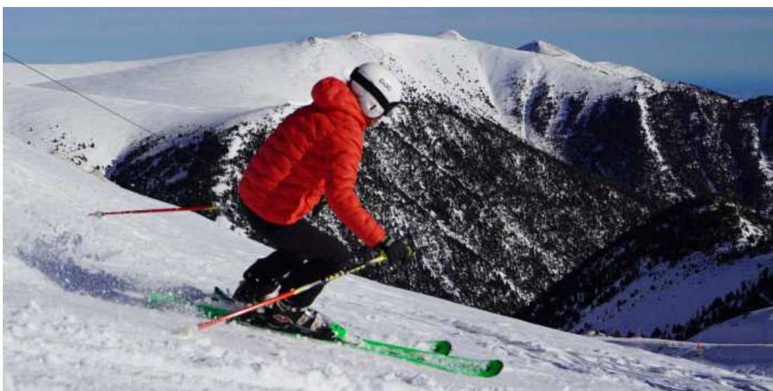
Vallter en una imatge del passat 19 de desembre

Vallter obrirà el 100% del domini, Espot i Port Ainé prop del 90% i La Molina tindrà en servei tots els sectors de l'estació