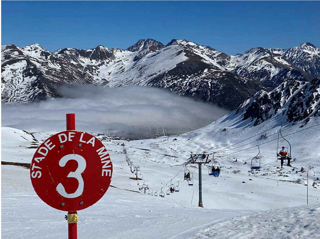
L'estació podrà ampliar el seu domini esquiable