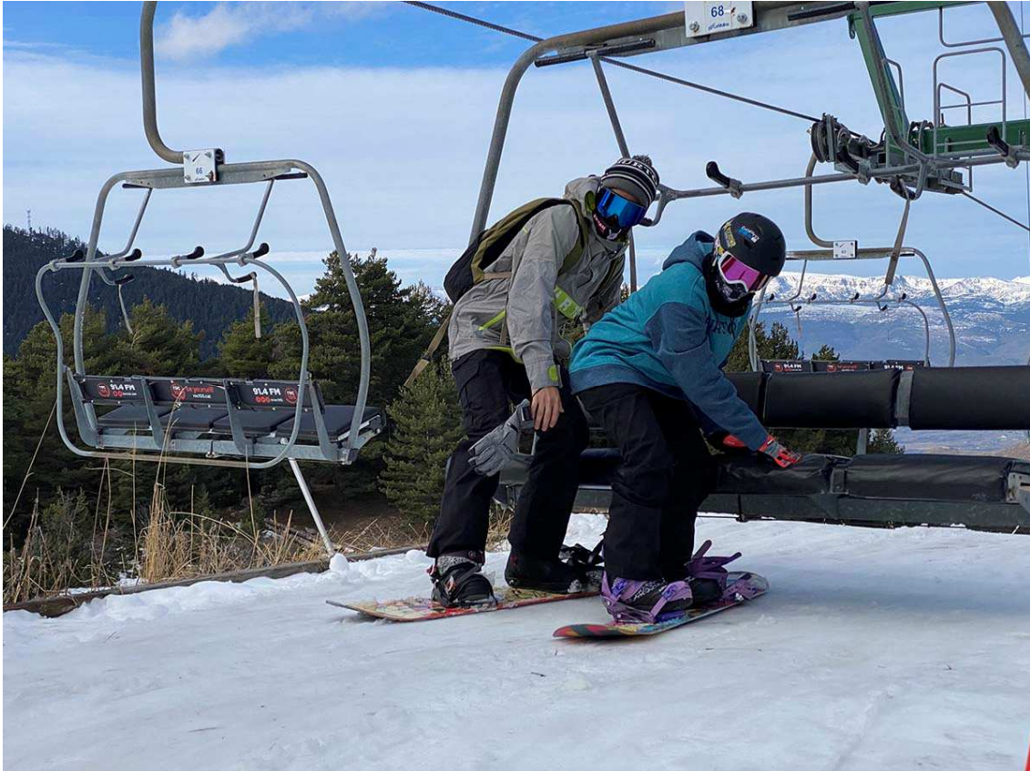
Practicants de surf de neu amb mascareta en un telecadira de La Molina l'hivern passat (Foto: Diaridelaneu.cat).