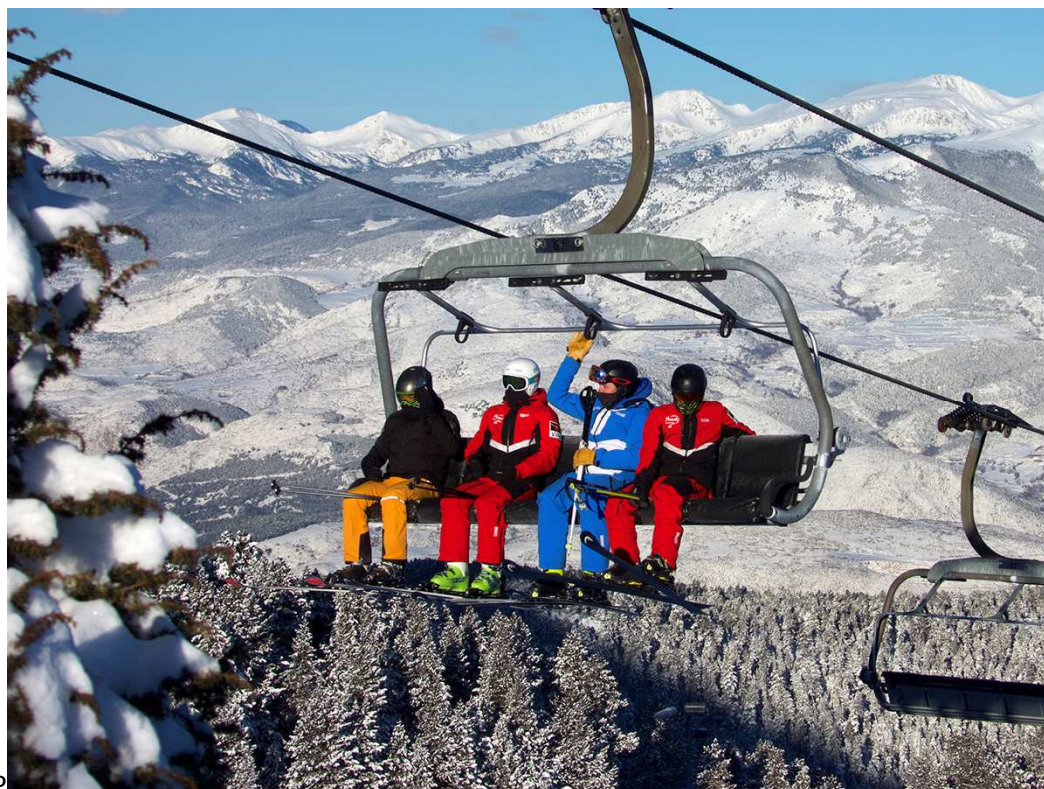
P Professors d'esquí l'hivern passat a Masella.

Quan fa gairebé un any del confinament perimetral a la Cerdanya i Ripollès , els sectors més perjudicats fan balanç del que va suposar la mesura. Tots coincideixen que no se'ls ha reparat tot el greuge viscut, després de perdre la temporada de Nadal i quedar-se sense reserves i neveres plenes. Reclamen més ajuts mentre encara hi ha sectors, com el de la distribució de la restauració, que no ha rebut ni un euro de la Generalitat. La neu i el bon ritme de reserves els porta a enfocar aquest Nadal amb més optimisme perquè la situació sanitària és diferent a fa un any, quan no hi havia vacunes. Remarquem que seguiran adaptant-se als protocols i que estan preparats per atendre els clients amb plenes garanties.