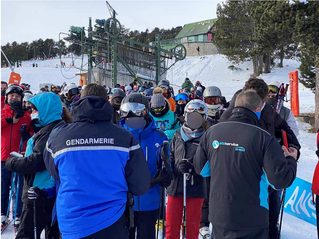
Operaris d'una estació d'esquí i agents de la gendarmeria demanen els certificats Covid a l'entrada d'un telecadira durant el passat pont de la Puríssima.