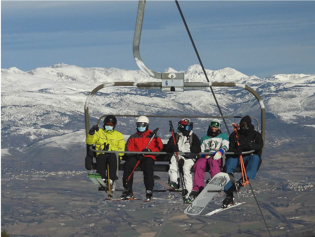
Esquiadors amb mascareta en un telecadira de Masella l'hivern passat (Foto: Masella - IST).

Un any després d'aquell tancament, viuen la nova temporada amb optimisme malgrat les incerteses que encara hi ha. "Venint del forat més negre (l'any passat), ho vivim amb cert optimisme, estem molt millor, tenim reserves, neu i estem contents de la resposta dels clients" , a qui agraeix juntament amb els proveïdors la comprensió i el suport durant tot aquest temps. Admet que els ERTA han sigut la millor eina per aguantar l'estructura. I la prova és que aquest hivern han passat de 21 treballadors a 24. Pel que fa als ajuts de la Generalitat per compensar el tancament, reconeix els esforços però creu que dependrà de cada cas per valorar si han sigut molt profitosos o no.