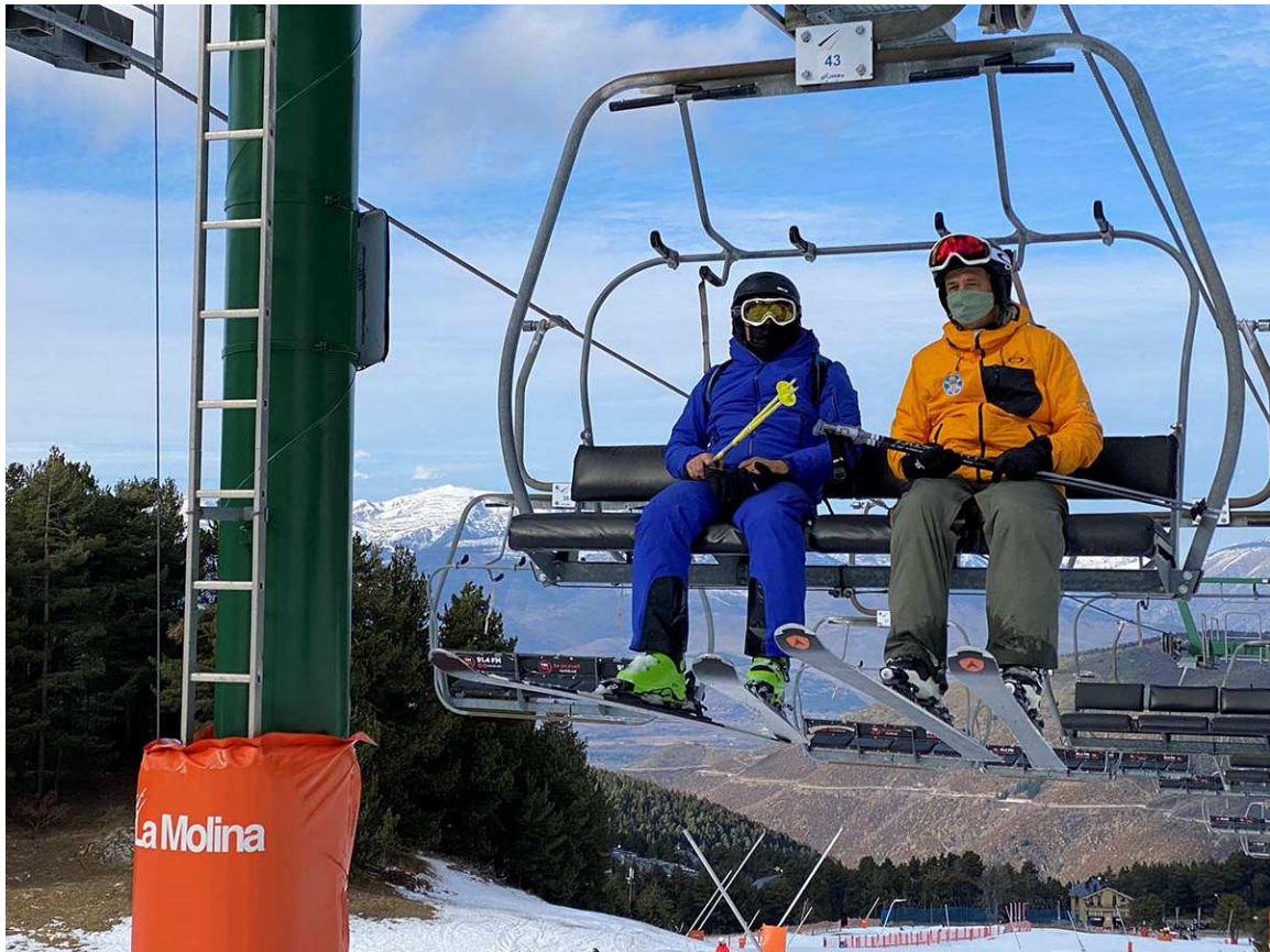
Esquiadors amb mascareta en un telecadira de La Molina l'hivern passat (Foto: Diaridelaneu.cat).