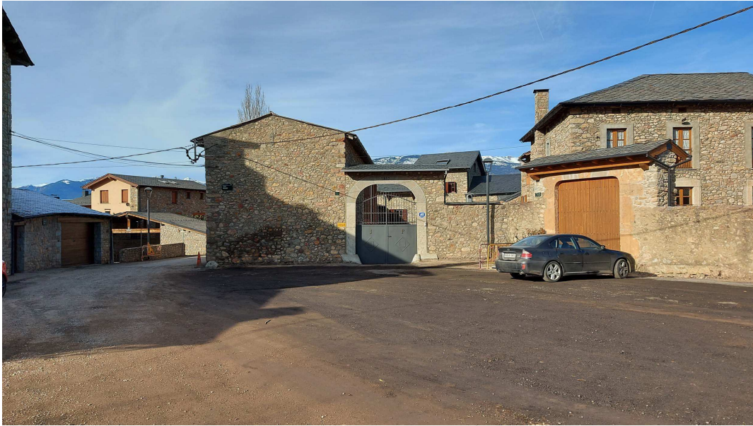
(Plaça Major de Bor, al municipi de Bellver de Cerdanya / FS)