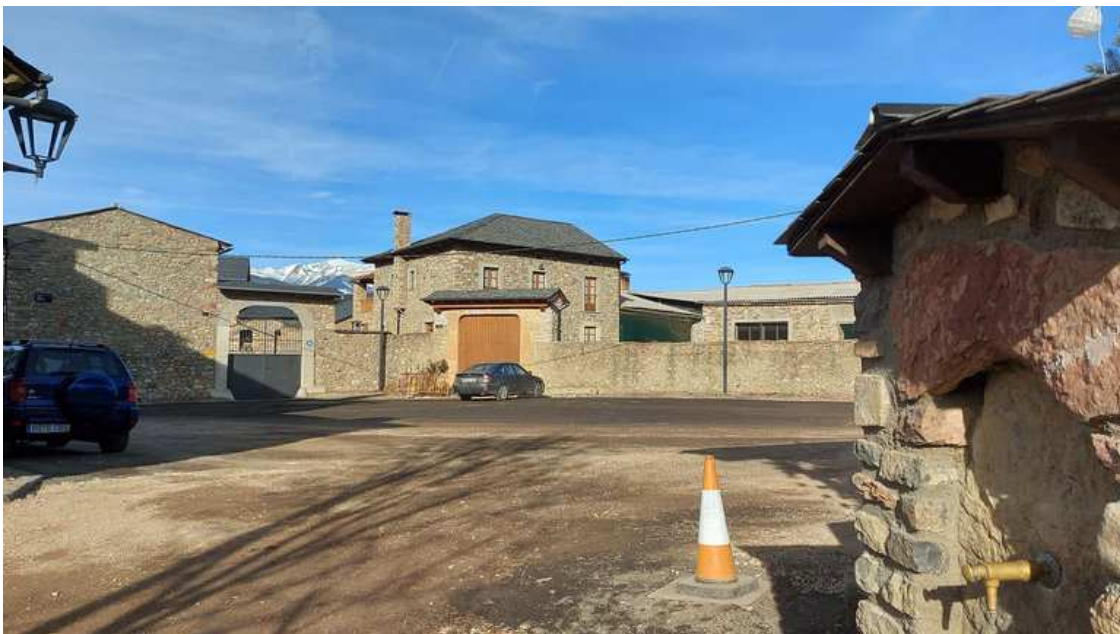
Plaça Major de Bor, al municipi de Bellver de Cerdanya

El projecte contempla la renovació íntegra de la plaça Major i de la xarxa viària que la travessa, així com la millora de la seva connexió amb la plaça Pere Pons.