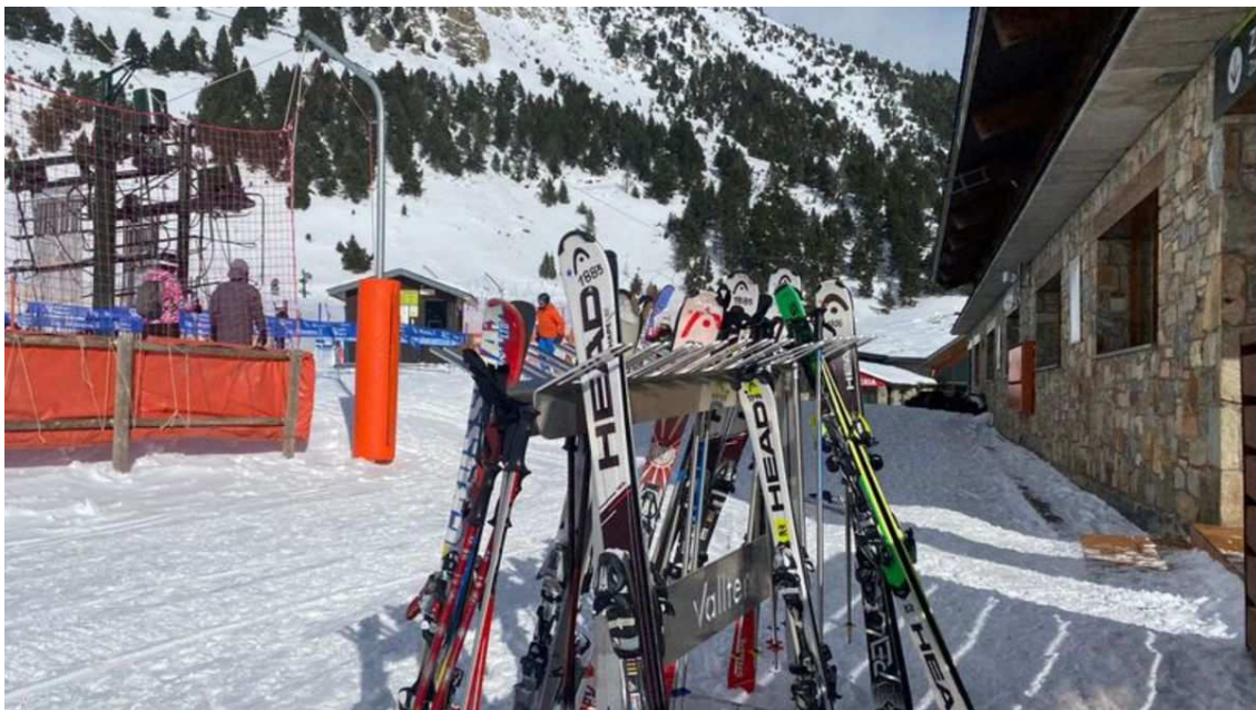
Estació d'esquí Vallter 2000 durant el pont.