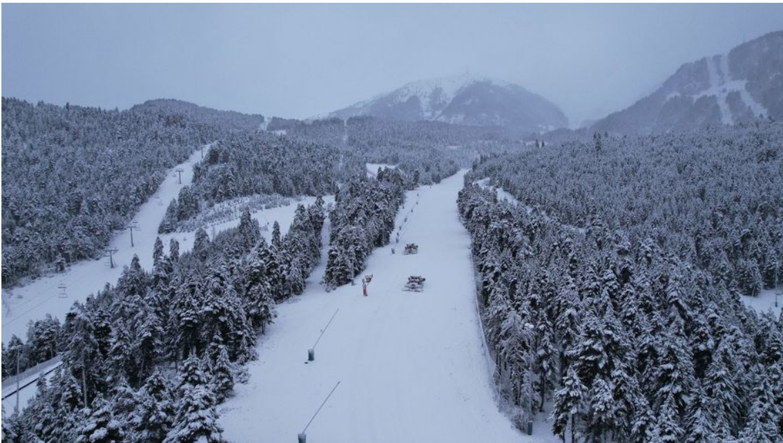
UNA de las máquinas pisapistas preparando la nieve