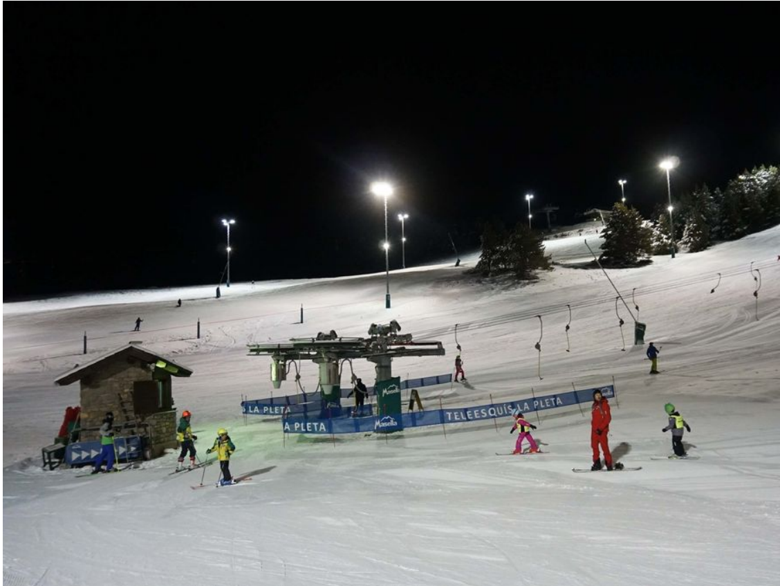
El snowpark de Masella también estará abierto por la noche