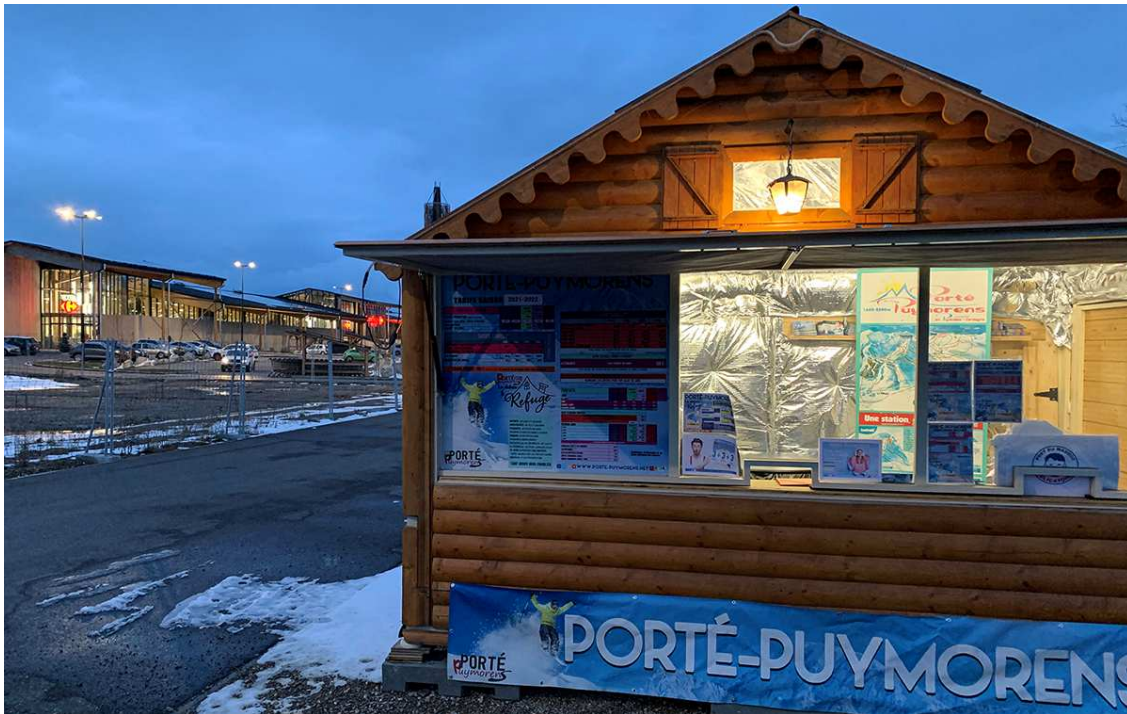
Oficina de Porté Puymorens a Ur (Foto: Porté Puymorens).