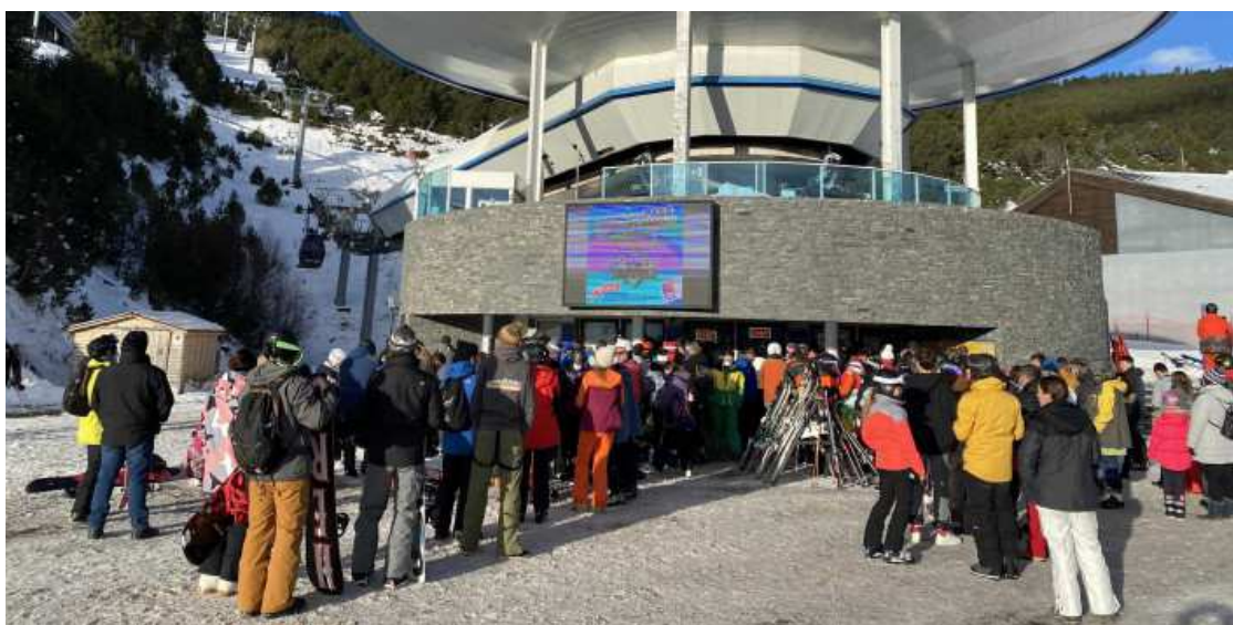
Més de 4.500 esquiadors avui a Les Angles

Els responsables de l'estació calculen que aquests dies un 45% d'aquests esquiadors són catalans 'del sud'