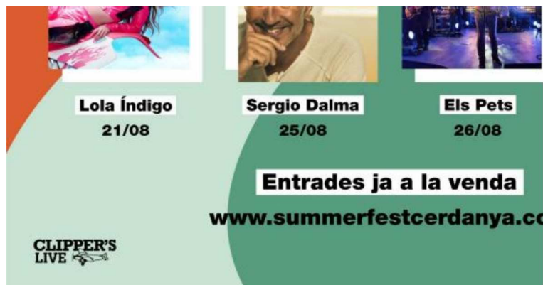
Imatge promocional del festival CLIPPER'S LIVE.