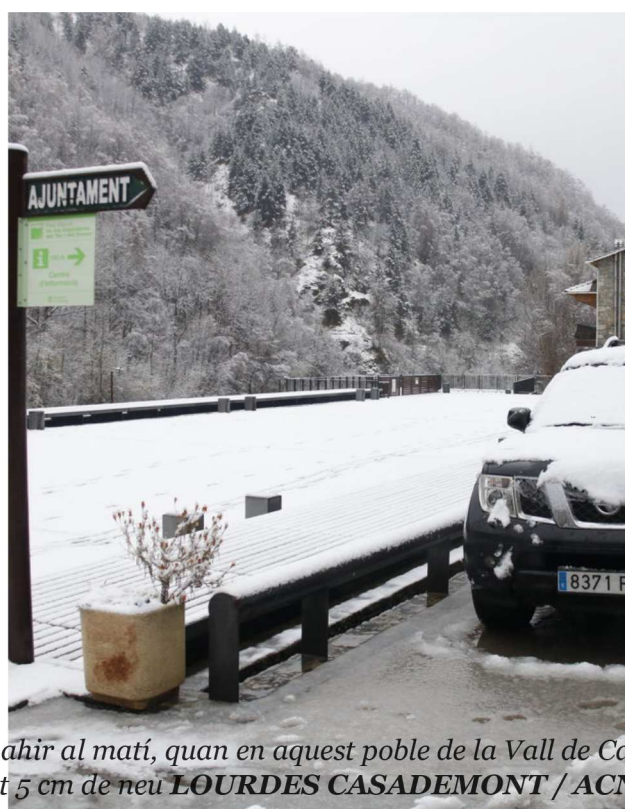
Setcases ahir al matí, quan en aquest poble de la Vall de Ca acumulat 5 cm de neu