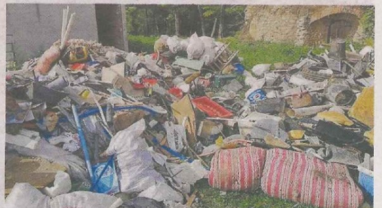
Una part dels abocaments il·legals a Osona.

segurant que eren gestors legals, però realment no tenien cap autorització de l'Agència de Residus. Entre tots els abocaments registrats, hi ha runa, roba, pneumàtics, electrònica, fluorescents, caixes de plàstic, ampolles de vidre, documentació i voluminosos.