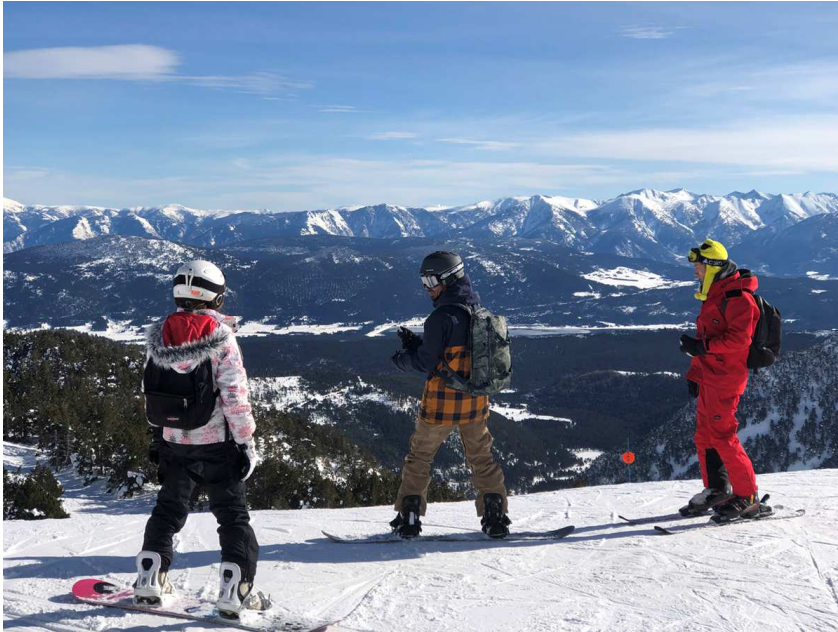
Formigueres en una imatge d'arxiu (Foto: arxiu DDLN).