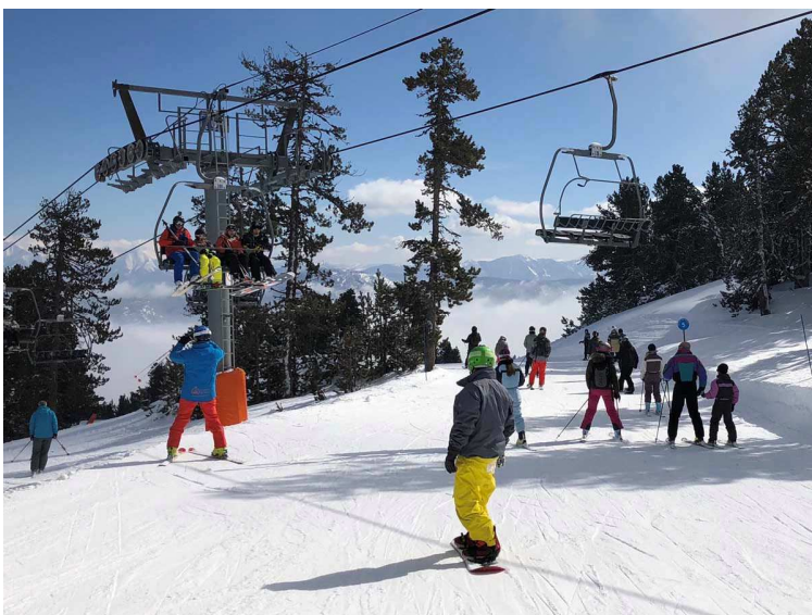
Formigueres en una imatge d'arxiu.

El forfet de temporada de Les Neus Catalanes per a la temporada 2021-22 és a la venda de forma anticipada i amb preus de promoció des d'avui mateix. Aquesta promoció finalitza el preu de descompte el proper 30 de novembre i permet un estalvi aproximat del 15%. Els preus es mantenen i són els mateixos que es van tarifar durant la passada temporada.