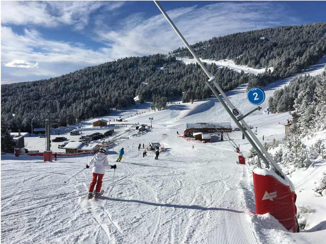
Esquiant pel sector Pla del Mir de Les Angles.

Una altra bona opció pensada per a les famílies és el forfet de temporada familiar. Per la compra simultània de 4 forfets de temporada (tarifa no promocional) en una mateixa família (excepte forfets gratuïts – de 5 anys i + de 70 anys), el forfet de menys valor econòmic surt a preu 0, és a dir, regal de Les Neus Catalanes .