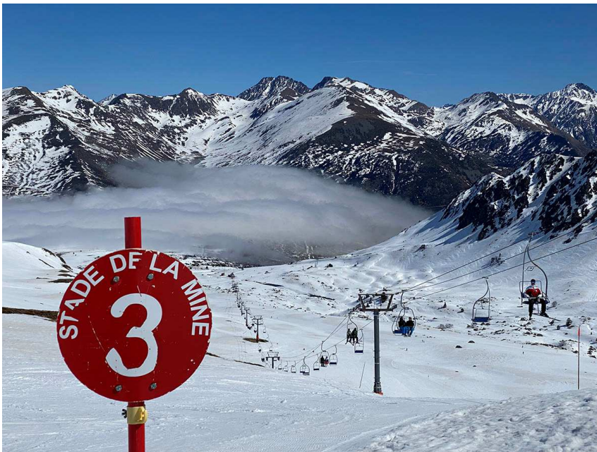
Porté Puymorens en una imatge d'arxiu.

El descompte per compra anticipada, fins al 30 de novembre, és d'aproximadament un 15%. Per exemple, el preu del forfet adult és de 726 euros, però fins a la data esmentada queda per 617 € . El mateix passi per a nens o estudiants universitaris és de 656 euros, mentre que ara i fins a final de mes queda per 557 €. Es consideren nens les edats compreses entre 5 i 12 anys, i es considera Universitaris els que van dels 18 als 24 anys. Per als universitaris cal aportar la documentació que acrediti la condició d'estudiant.