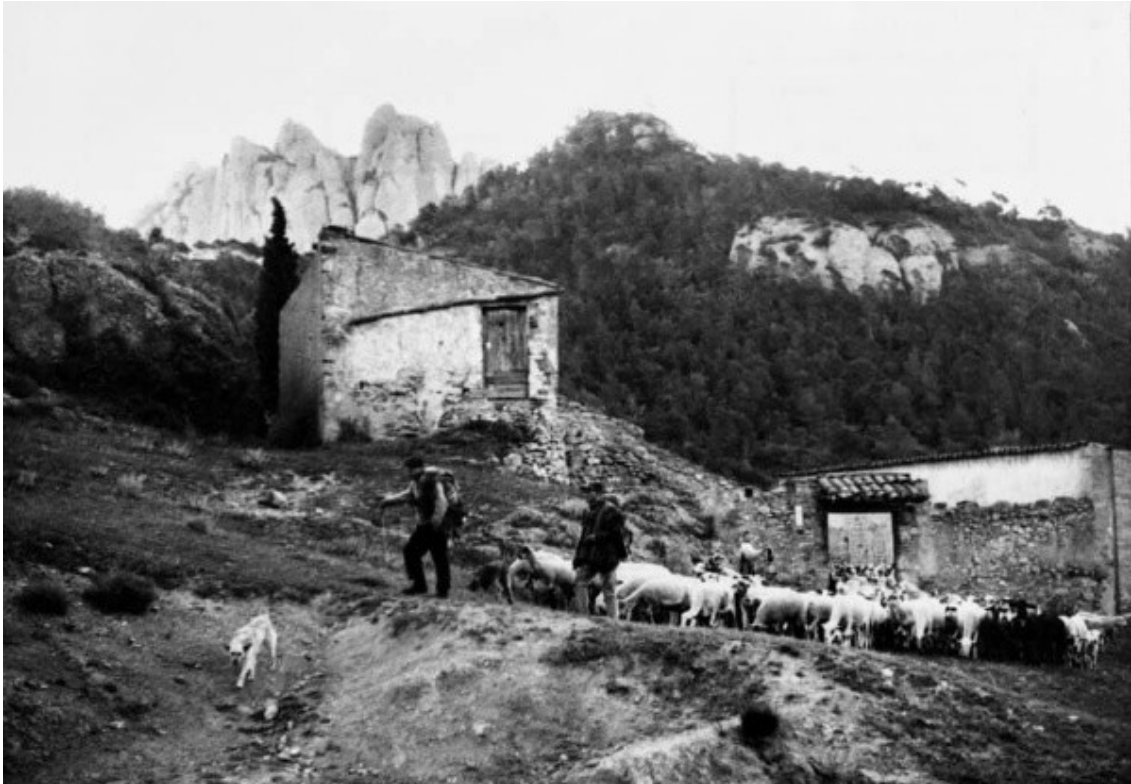
El camino unía la costa con Santa Coloma de Queralt.

Ahora Cunit está incorporado en la asociación como miembro de pleno derecho, lo que debe permitir participar de manera directa para coordinar el proyecto y poder extenderlo para recuperar patrimonio natural y cultural.