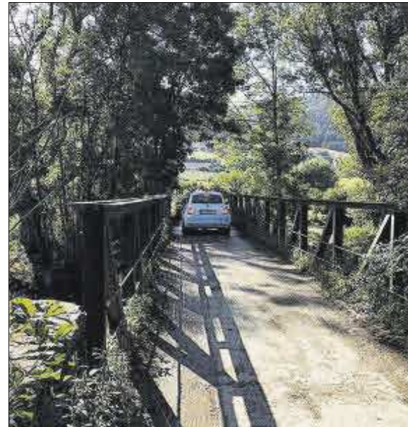
El pont vell, que serà per a ús d'oci