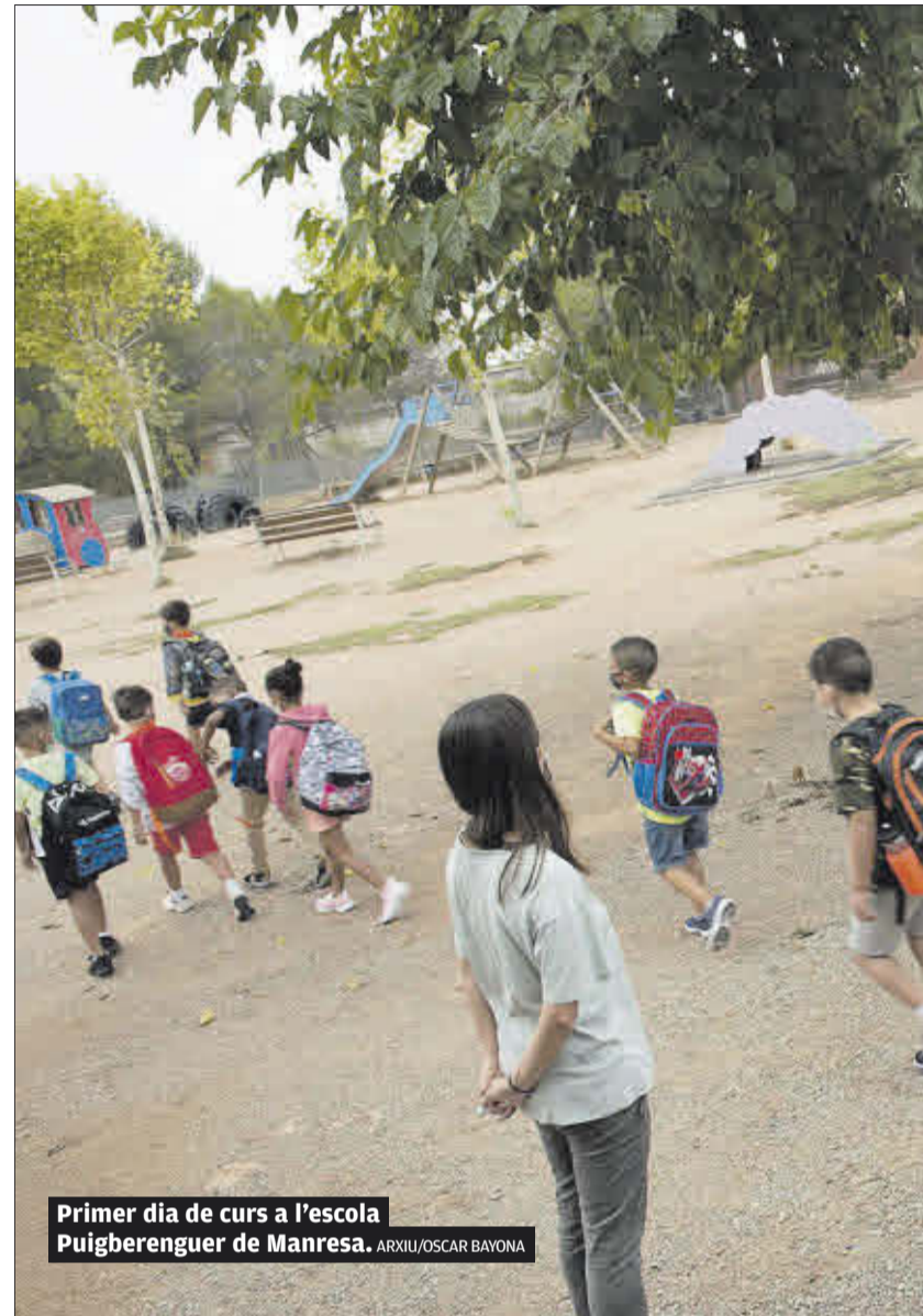
Primer dia de curs a l'escola Puigberenguer de Manresa.

Tal i com es pot veure detalladament en la gràfica d'evolució situada