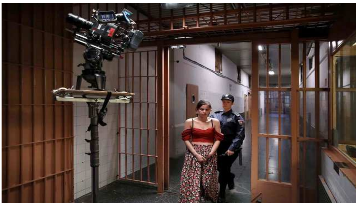
Un moment del rodatge de 'La dona ilegal', a la presó Model de Barcelona

Bellver de Cerdanya formarà part del Circuit Estable de Cinema Català, Cicle Gaudí, des d'aquest diumenge.