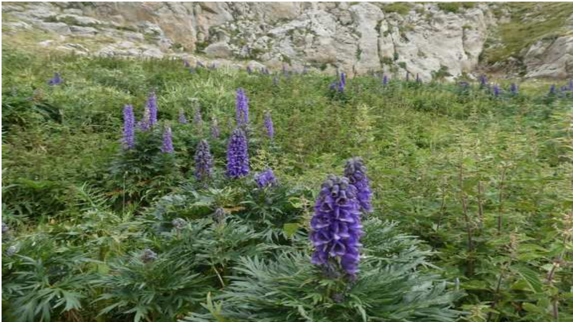
La Tora Blava, la planta més tòxica d'Europa, ja creix al Pirineu / Parc Natural Cadí-Moixeró

No hi ha cap animal que se la mengi i per això és tan abundant fins i tot en prats on pastura el bestiar.