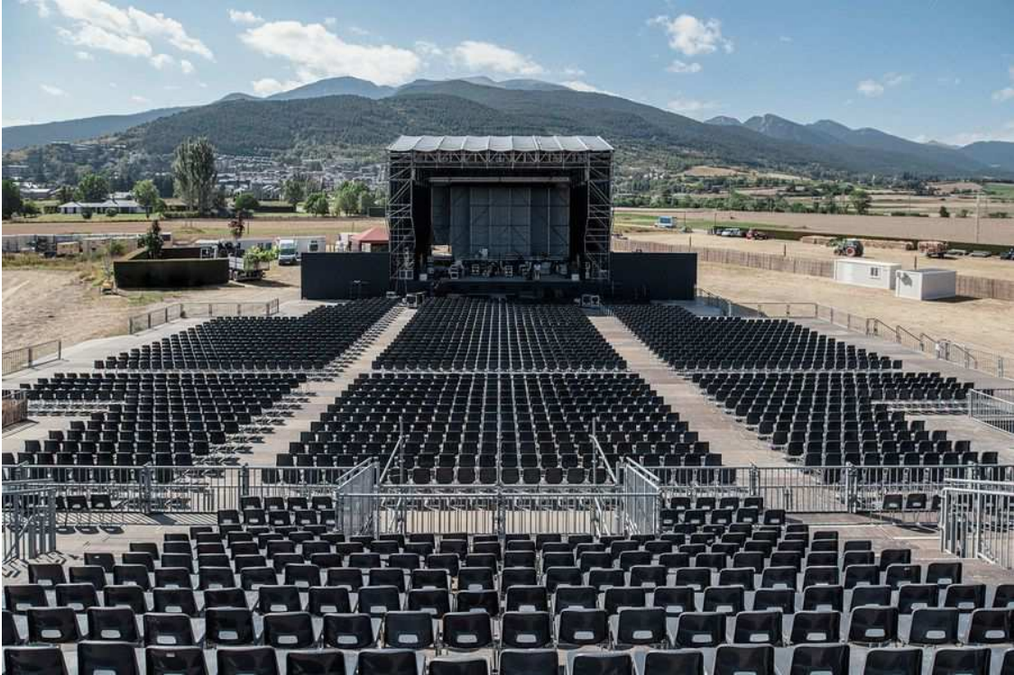
Lo que se ve al fondo es Masella...BRUTAL!

La primera edición de Cerdanya Music Festival constará de una decena de conciertos que tendrán lugar del 12 al 23 de agosto en un privilegiado campo frente a Alp, con unas vistas privilegiadas del Cadí y de Masella ...visto el montaje en vivo, dudo mucho que exista otro festival con semejantes vistas, UNA PASADA!