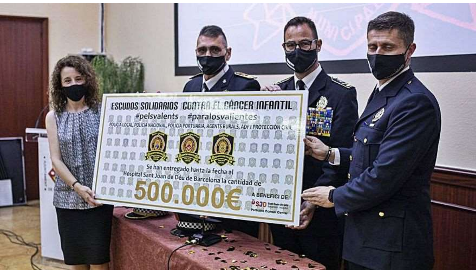
Els caps de Polícies impulsors i una responsable de l'hospital.

La campanya Pels Valents ha recaptat mig milió d'euros per la lluita contra el càncer infantil. Ahir es va celebrar una gala a Caldes per celebrar l'assoliment de la xifra i també es van